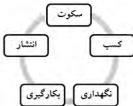
نمودار ۲: فرآیند مدیریت دانش با الهام از منابع اسلامی

با استفاده از روایاتی که بدان اشاره شد، می‌توان فرایند مدیریت دانش را از منظر اسلام، به‌صورت نمودار ذیل ارائه کرد: