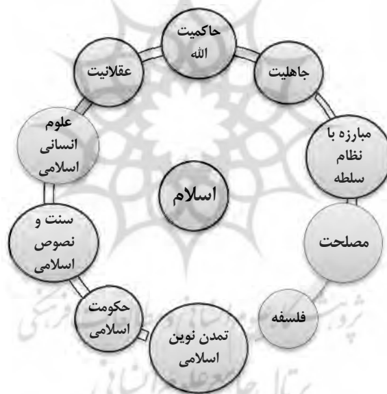
شکل (۳) نظام معنایی گفتمان تمدن‌گرایی

جاهلیتی جدید، عامل اصلی کنارنهادن دین از حوزه‌های عمومی و عامل ایجاد خلأ معنویت و فضیلت در جامعه می‌دانند؛ اما با وجود این و بر خلاف اصول‌گرایان قائل به طرد تمامی دانش‌های غربی نیستند. به این ترتیب گفتمان تمدن‌گرا به شیوه‌ای معنادار از مفصل‌بندی عوامل فوق تشکیل یافته و تصور و فهم تمدن‌گرایان از واقعیت را شکل داده است. تصویر گفتمان تمدن‌گرا از اسلام متأثر از سایر نشانه‌های مفصل‌بندی شده در این گفتمان است. اسلام در این گفتمان در قالب آموزه‌های موجود در اصول، سنت و نصوص اسلامی، عقلانیت و فلسفه متجلی است که می‌بایست بر مبنای اصول آن و با رویکردی عقل‌گرایانه و مصلحت‌اندیشانه آن را مبنای ایجاد تمدن نوین اسلامی قرارداد.