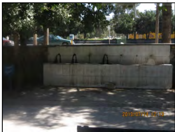
یافته‌های پژوهش. ۱۳۹۱

جغرافیدانان دریافته‌اند که ویژگی فضاهای پارک می‌تواند بر نوع استفاده از پارک تأثیر بگذارد. برای نمونه، تسهیلات و خدمات محدود و چشم‌اندازهای یک دست پارک، سطح استفاده از پارک را کاهش داده و یا مانع استفاده از تمام فضای پارک می‌شود. سرویس‌های بهداشتی کثیف و آلوده، تجهیزات ورزشی آسیب دیده، چمن و سبزه‌های له شده، گیاهان خشکیده، تسهیلات معیوب و لامپ‌های شکسته و ... ممکن است مانع استفاده شهروندان از تمامی امکانات پارک شود (Byrne, 2012: 297). از میان مکان‌ها و بخش‌های موجود در فضای پارک‌های شهری نورآباد که به شهروندان خدمات ارائه می‌دهند، بیشتر آن‌ها از نظر بهداشتی دارای مشکل و اکثراً دارای مناظری زشت و نازیبا می‌باشند (شکل شماره ۲).