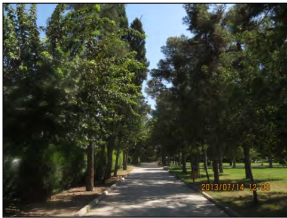
یافته‌های پژوهش. ۱۳۹۱

جغرافیدانان دریافته‌اند که ویژگی فضاهای پارک می‌تواند بر نوع استفاده از پارک تأثیر بگذارد. برای نمونه، تسهیلات و خدمات محدود و چشم‌اندازهای یک دست پارک، سطح استفاده از پارک را کاهش داده و یا مانع استفاده از تمام فضای پارک می‌شود. سرویس‌های بهداشتی کثیف و آلوده، تجهیزات ورزشی آسیب دیده، چمن و سبزه‌های له شده، گیاهان خشکیده، تسهیلات معیوب و لامپ‌های شکسته و ... ممکن است مانع استفاده شهروندان از تمامی امکانات پارک شود (Byrne, 2012: 297). از میان مکان‌ها و بخش‌های موجود در فضای پارک‌های شهری نورآباد که به شهروندان خدمات ارائه می‌دهند، بیشتر آن‌ها از نظر بهداشتی دارای مشکل و اکثراً دارای مناظری زشت و نازیبا می‌باشند (شکل شماره ۲).