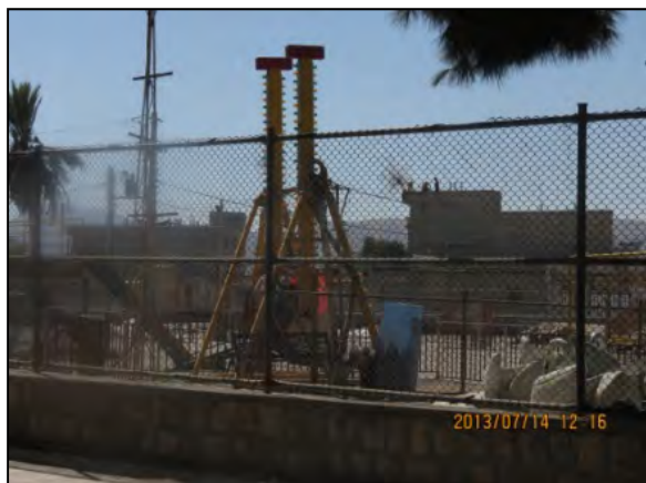
یافته‌های پژوهش. ۱۳۹۱

پارک‌ها و فضاهای سبز موجود در شهر نورآباد ممسنی به عنوان مرکز شهرستان به لحاظ ترجیحات مردمی دچار آسیب‌های خاصی می‌باشد و تنها یکی دو مورد از پارک‌های شهر مورد استفاده و استقبال شهروندان قرار می‌گیرد؛ در صورتی که فضای سبز و به‌خصوص پارک‌ها، جدای از ارزش‌های اکولوژیکی که برای شهرها دارند، دارای ارزش‌های اجتماعی می‌باشند و به‌عنوان محیط‌هایی که شهروندان برای فرار از استرس ناشی از محیط کار و خانه به چنین فضاهایی پناه می‌برند، شناخته می‌شوند. لذا می‌تواند با شناخت ترجیحات مردم، فضای درون پارک‌ها بگونه‌ای برنامه‌ریزی شود که مطلوب نظر شهروندان باشد، تا استقبال از تمامی پارک‌های موجود در سطح این شهر در تمامی ساعات و در تمامی روزهای سال مورد استقبال شهروندان قرار گیرد.