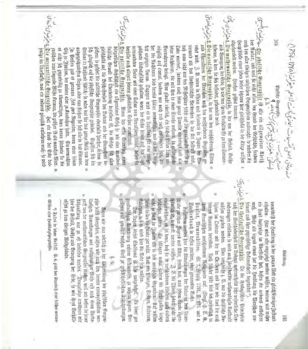
تصویر شماره ۴: متن اصلی و قدیمی جغرافیای سیاسی از: ایمانوئل کانت (Kant's werke, 1923: 164)