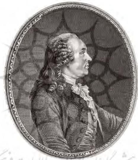
تصویر شماره ۱: آن روبرت ژاک تورگو، بنیان‌گذار جغرافیای سیاسی در سال ۱۷۵۱م

دولابلاش در جغرافیای انسانی مورد نظر خود، عملاً جغرافیای سیاسی را نادیده گرفت در حالی که به‌طور همزمان، در آلمان فردریش راتزل جغرافیای سیاسی را با موضوع کشور و حکومت تبیین نمود. در واقع جغرافیای انسانی ویدال دولابلاش همان جغرافیای سیاسی تورگو بود که بعد سیاسی آن توسط دولابلاش مورد غفلت قرار گرفت و تغییر عنوان پیدا کرد (Robic, 2013). البته ویدال دولابلاش، اقدام راتزل برای ایجاد شاخه جغرافیای سیاسی را نیز مورد انتقاد قرار داد (Herb, 2008: 28).