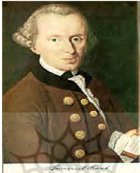
تصویر شماره ۳: ایمانوئل کانت، جغرافیدان و فیلسوف آلمان

ایمانوئل کانت در برنامه تدریس و در آثار خود در نیمه قرن هیجدهم میلادی از اصطلاح جغرافیای سیاسی که در زبان آلمانی پولیتیشه گیوکافی ۱ تلفظ می‌شود استفاده نمود (پولیتشه جئوگرافی). در مورد تاریخ دقیق کاربرد این اصطلاح توسط کانت روایت‌های گوناگونی وجود دارد و دقیقاً مشخص نیست چه زمانی برای اولین بار کانت از آن استفاده کرده است. زیرا کارهای کانت و تدریس‌های او توسط دانشجویانش در سال‌های بعد تنظیم و تدوین شده است. مانند هردر ۲ ، هسه ۳ ، کهلر ۴ و غیره. در این آثار اصطلاح جغرافیای سیاسی و مفهوم آن تا حدی بیان گردیده است. در واقع کانت جغرافیای سیاسی و سایر شاخه‌های جغرافیا را در چارچوب برنامه تدریس خود در زمینه جغرافیای طبیعی بیان کرده است (Stark, 2013: 1). کانت پس از شروع تدریس خود در زمینه جغرافیای طبیعی، در سال ۱۷۵۷ اظهار داشته که از