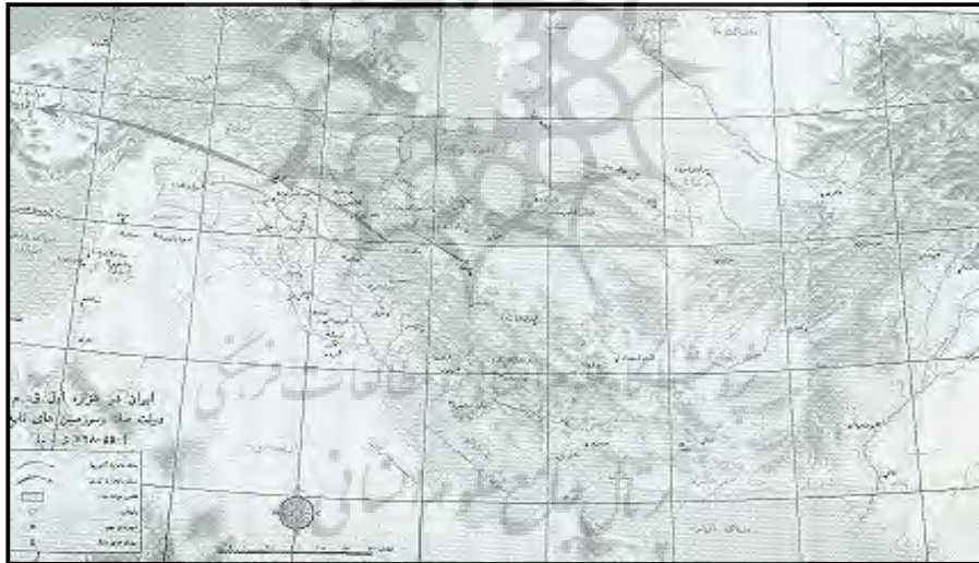
نقشه شماره ۱: قلمرو پادشاهی ماد و تقسیمات سیاسی آن (Iranian Historical Atlas)

خاندان تصمیم بگیرند قدرت را از دست آخرین پادشاه ماد یعنی ایستاگ که با این خاندان مشکلات فراوان داشت گرفته و به کورش پارسی بدهند و این پایان کار پادشاهان ماد و آغاز پادشاهی پارسیان در ایران بود. توزیع قدرت در این دوره اگر چه با نام پادشاهی ماد شناخته شده ولی قدرت بیشتر در دست خاندان حکومت‌گر بوده و شاه بیشتر نماد اتحاد مادها را داشت و از نظر فضایی قدرت تا حد زیادی غیرمتمرکز بوده است. مهمترین عامل که در توزیع قدرت در این دوره نقش ایفا می‌کرده موقعیت ایران بوده است که دولت آشور به همین دلیل چشم طمع به ایران داشت و این باعث شد که قبائل ماد تشکیل دولت متحد دهند. فرهنگ سیاسی در این دوره محدود به طبقه خاندان و نخبگان بوده که قدرت را در دست داشتند. و عواملی دیگر نیز مانند آب هوا و اقلیم ایران در نوع ساختار فضایی قدرت در این دوره مؤثر بوده‌اند.