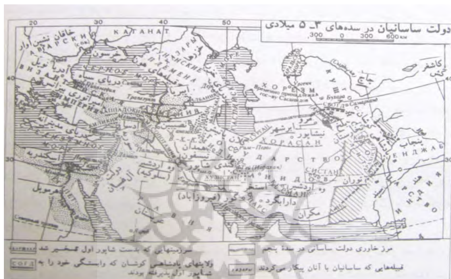
نقشه شماره ۴: قلمرو جغرافیایی ایران در دوره ساسانیان (Iranian Historical Atlas)

پایه‌گذار آن بودند و در ساختار قدرت مردم هیچ جایگاهی نداشتند و حق انتخاب به‌طور کامل در این دوره از مردم سلب شده بود و قدرت در دستان شاه و مغان متمرکز شده بود.