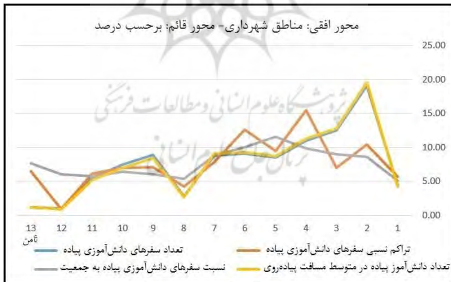
شکل (۳) نمودار تغییرات شاخص‌های محاسبه شده در مناطق شهرداری مشهد