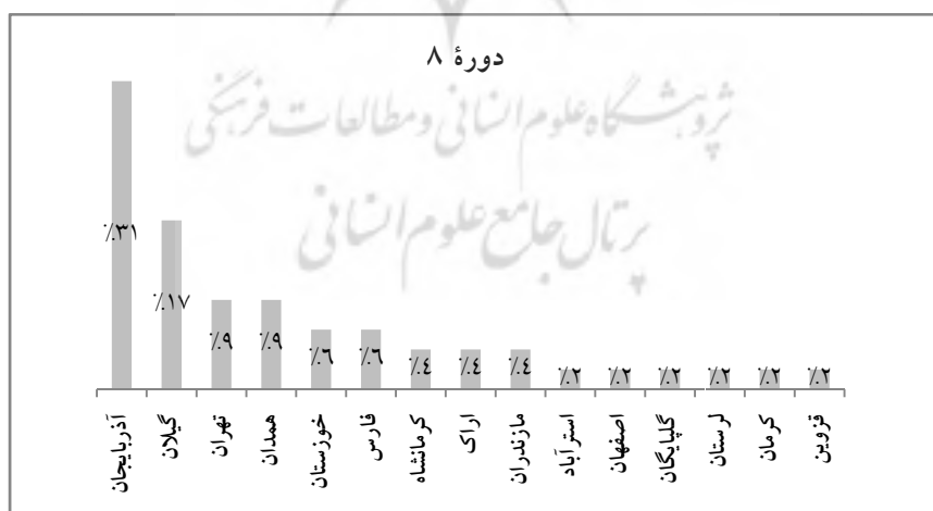
نمودار ۳. پراکنندگی جغرافیایی عرایض دوره هشتم

دوره هشتم: تهران (۴ شکایت)، کرمانشاه (قصرشیرین) (۲ شکایت)، خوزستان (۳ شکایت)، آذربایجان (۱۵ شکایت)، قزوین (۱ شکایت)، اراک (۲ شکایت)، کرمان (سیرجان) (۱ شکایت)، فارس (شیراز) (۳ شکایت)، گیلان (۸ شکایت)، همدان (۴ شکایت)، لرستان (بروجرد) (۱ شکایت)، مازندران (بارفروش) (۲ شکایت)، استرآباد (۱ شکایت)، گلپایگان (۱ شکایت)، اصفهان (۱ شکایت).