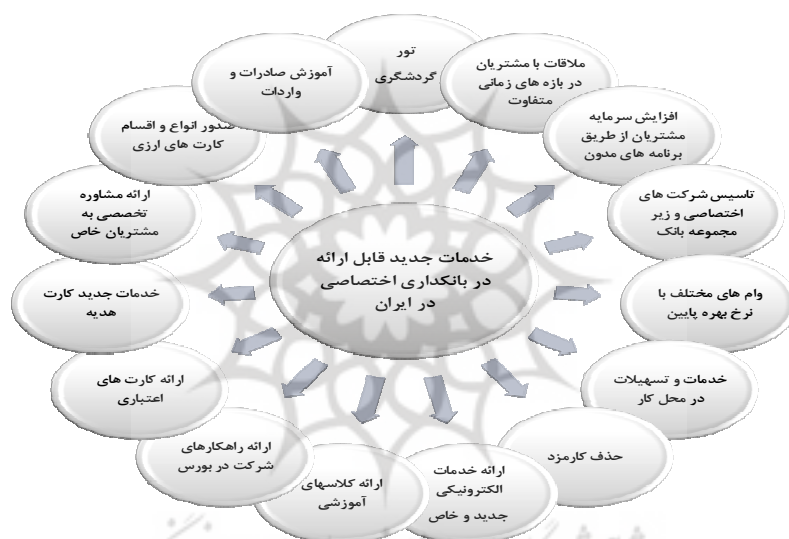
نمودار ۲. خدمات جدید قابل ارائه در بانکداری اختصاصی در ایران

برای پاسخ به آخرین پرسش مطرح شده در این پژوهش که به نوعی با امکان‌سنجی توسعه خدمات بانکداری اختصاصی در کشور مطرح شده است محققین بر آن بودند تا خدمات بالقوه جدیدی را شناسایی نمایند که می‌توان در بانک‌های ایرانی و در قالب طرح بانکداری اختصاصی مطرح نمود، بنابراین در پاسخ به این پرسش موارد مناسبی مطرح شد که برخی از آنها از منظر ادبیات بانکداری اختصاصی جدید بوده و می‌تواند نقطه عطفی در راه توسعه این حوزه باشد. فهرست این خدمات در قالب نمودار (۲) به تصویر کشیده شده است.