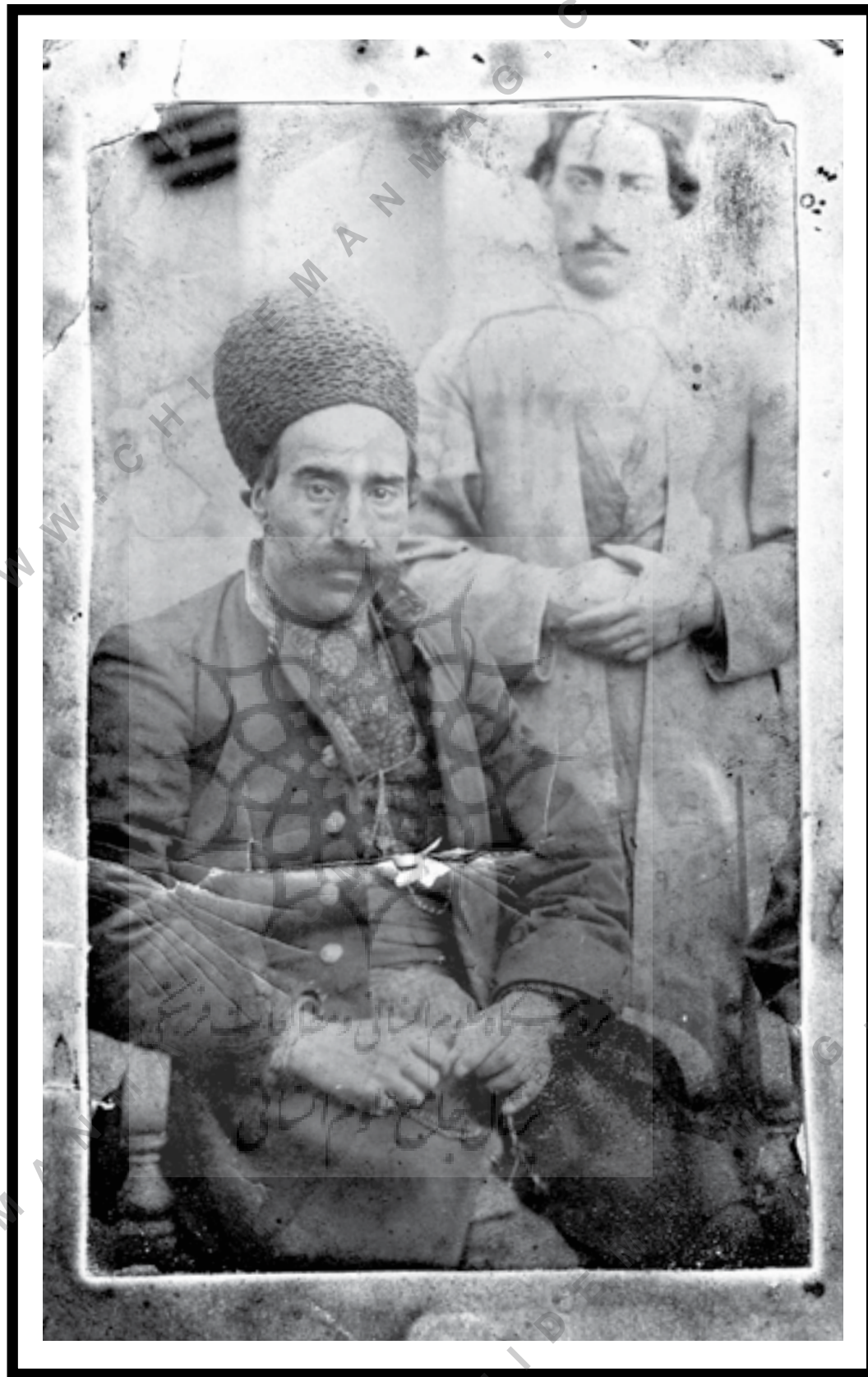
مرحوم آقای سیدرضا کافی (معروف به سیدرضا لوطی) یکی از مبارزین دوره رضاخان که در تاریخ یزد هم نامی از ایشان برده شده است.