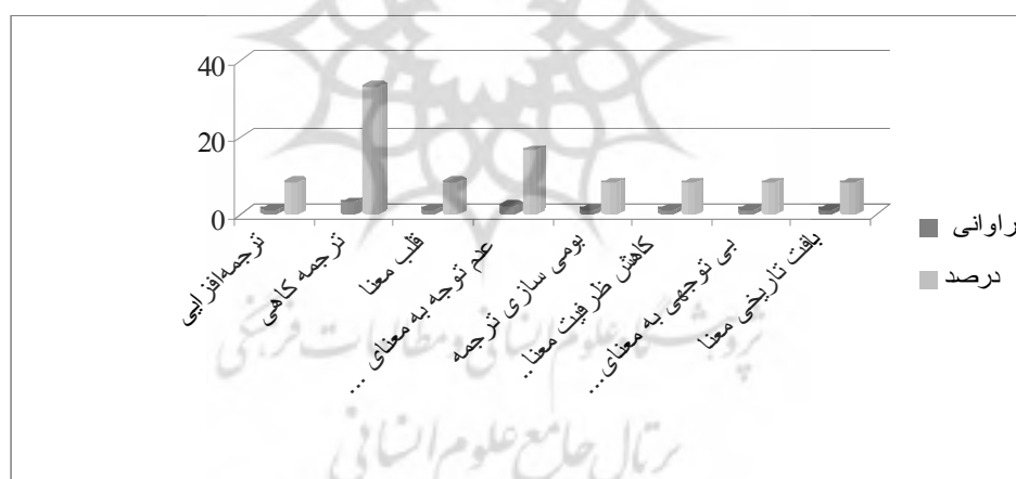
شکل ۳. ویژگی‌های معناشناختی نقد ترجمه در دهه ۱۳۵۰