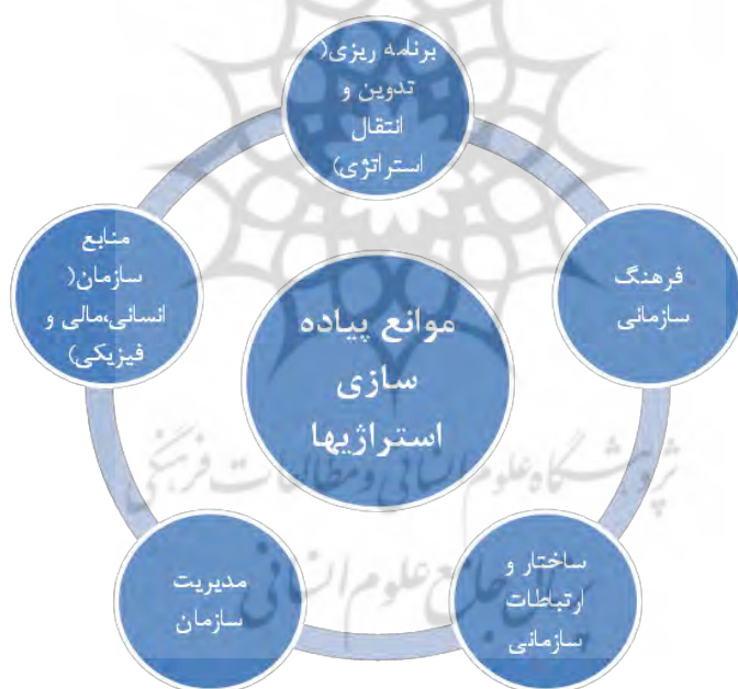
شکل ۱. دسته‌بندی موانع پیاده‌سازی استراتژی‌ها بر اساس ادبیات موضوع

پس از بررسی ادبیات و پیشینه‌ی مرتبط با موضوع پژوهش، موانع موجود شناسایی و در قالب ۵ مؤلفه‌ی موانع برنامه‌ریزی (تدوین و انتقال استراتژی)، موانع فرهنگ سازمانی، موانع منابع سازمانی (انسانی، مالی و فیزیکی)، موانع ساختار و ارتباطات سازمانی و موانع مدیریت سازمان دسته‌بندی شد (شکل ۱).