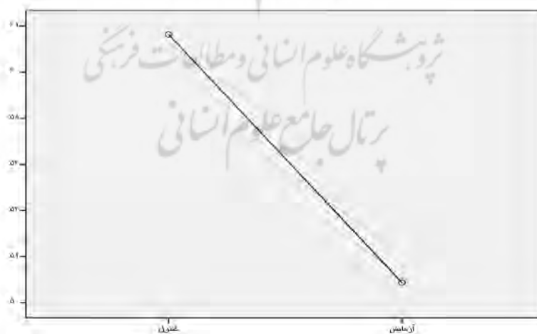
نمودار ۲: میانگین تعدیل شده گروه‌ها در پس‌آزمون اضطراب موقعیتی

بنابراین، قسمت اول فرضیه دوم پژوهش تأیید می‌شود.