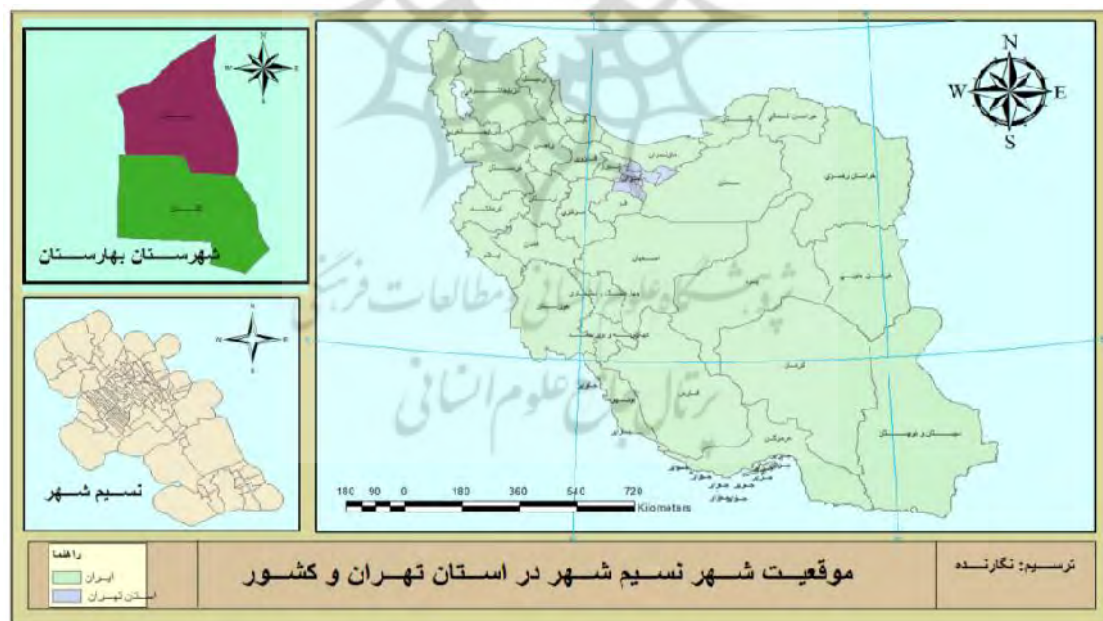
نقشه (۱): موقعیت نسیم شهر در استان تهران و شهرستان بهارستان

بخش بوستان به مرکزیت شهر نسیم شهر در فاصله ۱۵ کیلومتری جنوب غربی تهران واقع شده و از توابع شهرستان بهارستان است. این شهر از شرق به شهرستان اسلامشهر، از غرب به شهرستان رباط‌کریم، از شمال به شهرستان شهریار و آزادراه تهران - ساوه و از جنوب به جاده قدیم تهران - ساوه محدود است. شهر نسیم شهر در موقع جغرافیایی ۳۰° و ۳۵° درجه عرض شمالی از خط استوا و ۱۵° و ۵۱° درجه طول شرقی از نصف‌النهار گرینویچ قرار دارد (مهندسین مشاور آبان، ۱۳۹۰: ۴۲-۴۳). محدوده‌ای که وضع موجود محدوده شهر نسیم شهر را تشکیل می‌دهد تا سال ۱۳۴۵ فاقد جمعیت بوده و اغلب شامل اراضی کشاورزی و یا بایر بوده و فقط اکبرآباد با ۹۱ نفر جمعیت در اسناد سرشماری ۱۳۴۵ دارای سکنه گزارش شده است. در سال ۱۳۵۵ در این محدوده بالغ بر ۲۰۹۲ نفر سکنه گزارش شده است. در طول سی سال گذشته (۸۵-۱۳۵۵) که نتایج سرشماری‌های عمومی نسیم شهر گزارش شده است، شمار سکنه این شهر نزدیک به ۶۵ برابر شده و از ۲۰۹۲ نفر به ۱۳۵۴۸۶ بالغ گردیده است و در سال ۱۳۹۰ به ۱۵۷۴۵۷ نفر رسیده است. بررسی روندهای رشد سالانه نیز حاکی است که روندهای رشد در این شهر همواره با میزان‌های بالایی روبرو بوده است (مهندسین مشاور آبان، ۱۳۹۰: ۱۴).