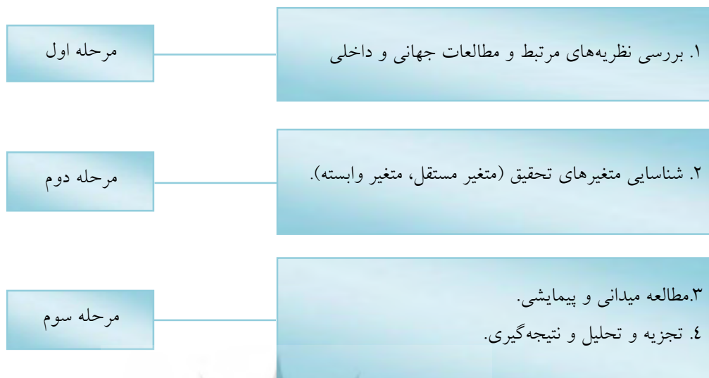
شکل (۱): مدل مفهومی مراحل انجام تحقیق

این پژوهش که به شیوه توصیفی - تحلیلی انجام شده است مراحل زیر را دارا است: