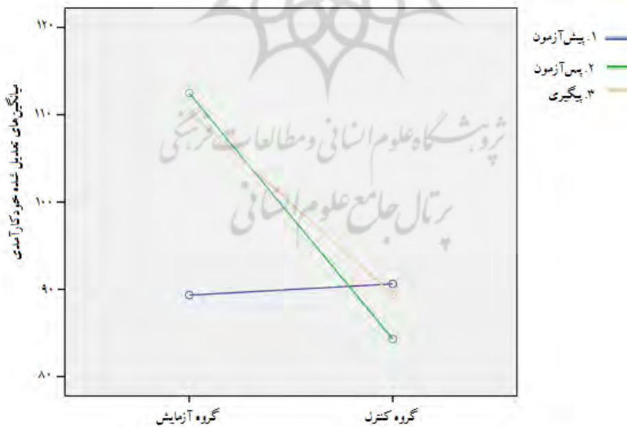
نمودار ۲. میانگین‌های تعدیل شده خودکارآمدی