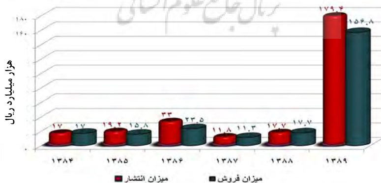
نمودار ۲. میزان انتشار و فروش اوراق مشارکت در دوره (۱۳۸۴-۱۳۸۹)

آغاز انتشار اوراق مشارکت در سال ۱۳۷۳ و مقبولیت و استقبال بی‌نظیر مردم از این اوراق باعث شد میزان انتشار اوراق همواره روند صعودی داشته باشد، به طوری که از نمودار (۲) مشخص است میزان انتشار اوراق در سال ۱۳۸۹ معادل ۱۷۹ هزار میلیارد ریال و میزان فروش آن معادل ۱۵۷ هزار میلیارد ریال و این رقم معادل ۶ درصد از کل سپرده‌های نظام بانکی و ۲۸ درصد از افزایش کل سپرده‌های بانکی در سال ۱۳۸۹ می‌باشد (گزارش اقتصادی و ترازنامه بانک مرکزی).