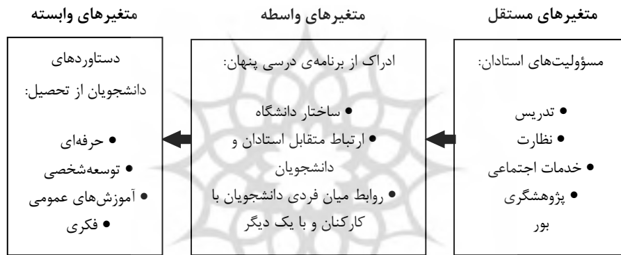
شکل ۱: مدل مفهومی دستاوردهای دانشجویان از تحصیل

این پژوهش با ارائه مدلی متشکل از مسؤولیت‌های استادان (شامل تدریس، نظارت، خدمات اجتماعی و تحقیق) به‌عنوان متغیر برون‌زای اولیه (مستقل)، برنامه‌ی درسی پنهان شامل ساختار دانشگاه، ارتباط متقابل استادان و دانشجویان و روابط میان فردی دانشجویان با کارکنان و با یک دیگر به‌عنوان متغیر واسطه و دستاوردهای دانشجویان از تحصیل شامل دستاوردهای حرفه‌ای، دستاوردهای فکری، توسعه شخصی و آموزش‌های عمومی به‌عنوان متغیر درون‌زای نهایی (وابسته)، در نظر دارد تأثیر ادراک دانشجویان از مسؤولیت‌های استادان را بر ادراک آنان از برنامه‌ی درسی پنهان و به واسطه آن دستاوردهای‌شان از تحصیل را نمایان سازد. مدل مفهومی ارائه شده در شکل شماره (۱) نشان داده شده است.