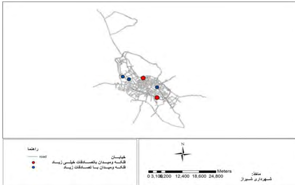
نقشه شماره ۲- توزیع فضایی تصادفات در میدان و فلکه بر حسب تعداد