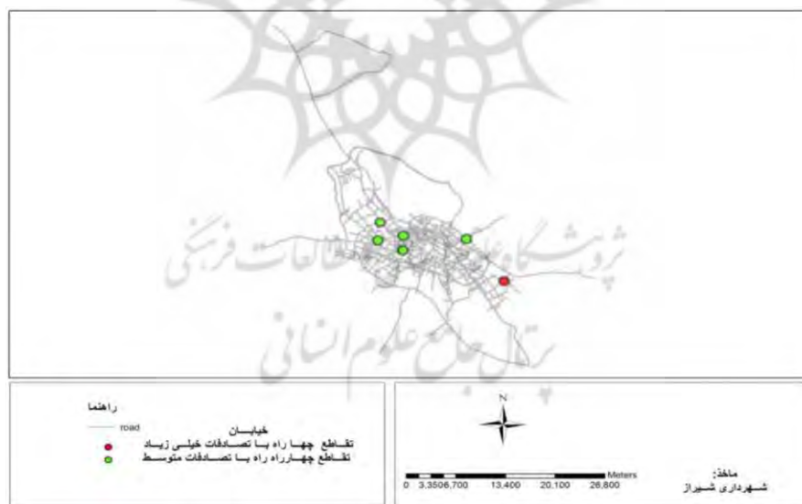
نقشه شماره ۳- توزیع فضایی تصادفات در تقاطع و چهار راه‌ها بر حسب تعداد

حوادث ترافیکی چهار راه خلدبرین متأثر از نقش ارتباطی آن با جنوب به بلوار زرهی، از سمت شمال به چهارراه ملاصدرا را که یکی از مراکز عمده خرید در شهر شیراز است و از سمت شرق تحت تاثیر تقاطع دروازه کازرون است که مهمترین مرکز فروش میوه و تره بار و مواد پروتئینی شهر شیراز است و در چهار راه ستارخان وجود مراکز پزشکی مانند بیمارستان فوق تخصصی چشم پزشکی دکتر خدا دوست، بیمارستان تخصصی دنا و به نقش ارتباطی شمال به جنوب این چهار راه می‌توان اشاره کرد. در گروه چهارم و پنجم تقاطع‌های با اهمیت کم عمدتاً در مراکز حاشیه و قسمت‌های مرکز قرار دارند که تعداد حوادث ترافیکی آنها ناچیز است.