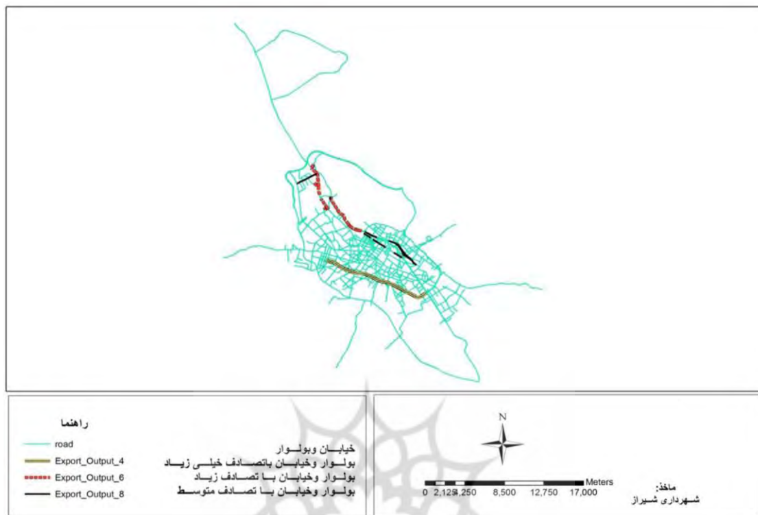
نقشه شماره ۱- توزیع فضایی تصادفات در بولوار و خیابان بر حسب تعداد

عمدتاً معابر مناطق مرکزی که بخش عمده آن بافت‌های فرسوده است و همچنین شریان‌های درجه ۳ و ۲ که اهمیت آنها کمتر است قرار دارند.