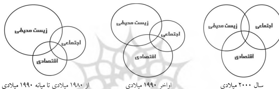
شکل ۲: ابعاد مختلف توسعه پایدار و اهمیت نسبی هر یک از این حوزه‌ها

اگرچه واژه تخصصی توسعه پایدار به طور کلی در بردارنده بررسی مسائل زیست‌محیطی بوده است اما پس از مدتی حوزه اقتصاد نیز در توسعه پایدار اهمیت یافت، با این وجود مباحث اجتماعی فقط از اواخر دهه ۱۹۹۰ در دستور کار توسعه پایدار قرار گرفت و پس از دستورکار ۲۱ و استراتژی لیسبون در سال ۲۰۰۰ و در نهایت نشست اتحادیه اروپا در گوتنبرگ در سال ۲۰۰۱، پایداری اجتماعی بسیار مورد توجه قرار گرفت (شکل ۲) (Colantonio & Lane, 2007:3). با این وجود نخستین بار در سال ۲۰۰۰، اتحادیه اروپا ۱ در لیسبون مباحث اجتماعی را به عنوان بخش جدایی‌ناپذیر مدل‌های توسعه پایدار تعریف کرد (Samuelsson et al, 2004).