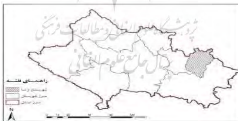
نقشه شماره ۱- موقعیت فضایی شهرستان ازنا در استان لرستان

شهرستان ازنا در طول شرقی بین ۴۹ درجه و ۱۳ دقیقه تا ۴۹ درجه و ۴۰ دقیقه و در عرض شمالی بین ۳۳ درجه و ۱۲ دقیقه تا ۳۳ درجه و ۴۵ دقیقه از نصف النهار گرینویچ قرار دارد. این شهرستان دارای ۲ بخش