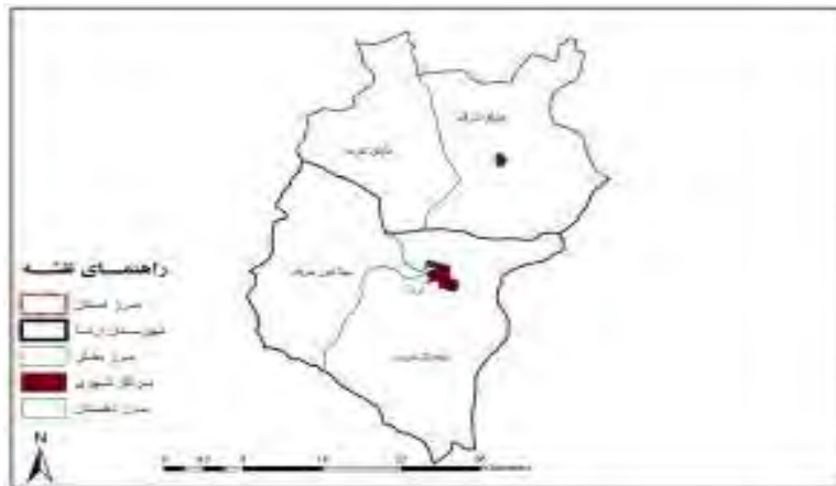
نقشه شماره ۲- موقعیت فضایی دهستان سیلاخور شرقی در شهرستان ازنا