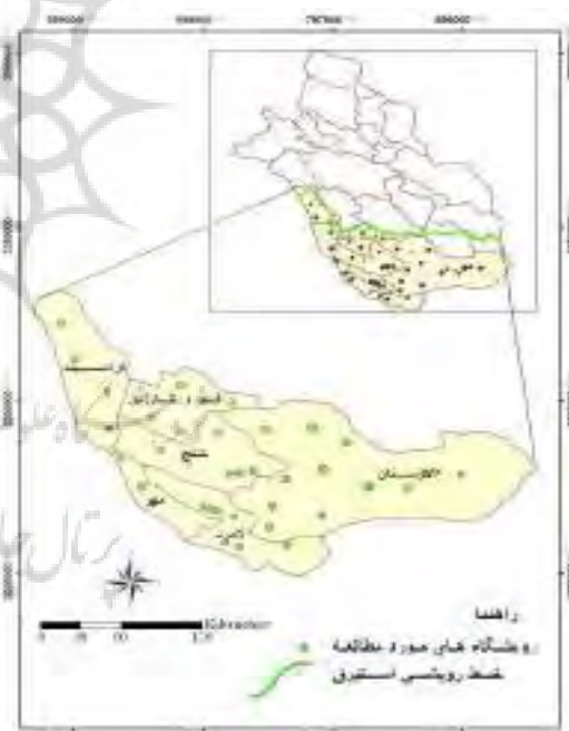
شکل ۱: نقشه خط رویشی استبرق و پراکنش رویشگاه‌های مورد مطالعه

نقشه پراکنش و خط رویشی استبرق مشخص و تهیه گردید. از آنجا که مطالعه شرایط رویشگاهی گیاهی چون استبرق، با فراوانی کم و پراکنده مد نظر بود از روش نمونه‌برداری انتخابی جهت انتخاب رویشگاه استفاده شد (زبیری، ۱۳۸۶). در مجموع ۳۵ رویشگاه مورد مطالعه قرار گرفت. نمونه‌برداری مشخصات گیاهی در داخل هر رویشگاه شامل درصد پوشش تاجی و تراکم بترتیب از ترانسکت خطی و شمارش تعداد کل در واحد سطح انجام گرفت. موقعیت جغرافیایی رویشگاه‌ها و نقاط نمونه‌برداری توسط GPS ثبت و با استفاده از نرم‌افزار ArcGIS نسخه ۹/۲ بر روی نقشه منتقل گردید (شکل ۱).