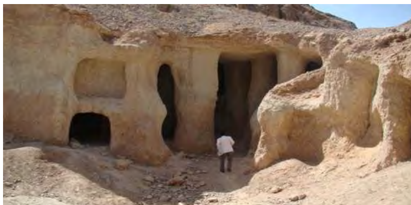
شکل (۳) دست کن‌ها یا بوکن‌ها مسکنی که در حد فاصل مناطق پرودتی و آخرین پیشرفت زبان‌های یخی ایجاد میشده است. یزد اسلامشهر (فرشاه)

سرزمینی خاصی را سبب میشوند و سرزمین ایران تنوع چشم اندازهای طبیعی و اجتماعی خود را مدیون این روابط و ویژگی‌هاست. به عبارت دیگر سیستم شکل‌زا مفهومی است معطوف به یک سامانه سازمند در طبیعت که منجر به شکل دادن سطوح ارضی می‌شود و ضمن آنکه قلمرو مستقلی را در حوزه فرایندهای شکل‌زا تعریف میکند به هويت بخشی مکان که زیربنای هويت زمین بوم‌های اجتماعی ایران است می‌پردازد