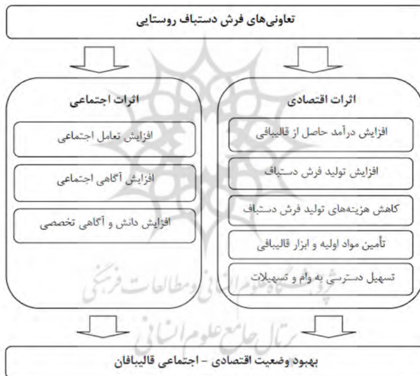
شکل (۱) مدل مفهومی تحقیق

داشته‌اند که بهبود وضعیت اقتصادی و اجتماعی قالببافان عضو از مهم ترین اثرات آن‌ها در سطح خرد می باشد. از جمله اثرات اقتصادی تعاونی‌های فرش دستباف می توان به افزایش درآمد، افزایش کمیت فرش دستباف، کاهش هزینه‌های تولید، تأمین مواد اولیه، تأمین ابزار کار و تأمین تسهیلات و اعتبارات و از جمله اثرات اجتماعی آن‌ها نیز می توان به افزایش مشارکت اجتماعی، افزایش سطح آگاهی و آموزش، بهبود کیفیت زندگی، افزایش رضایت از کار و زندگی، افزایش منزلت اجتماعی، بهبود شرایط کارگاه و محیط کار و برخورداری از خدمات اجتماعی اشاره کرد. بنابراین مدل مفهومی تحقیق به صورت زیر می باشد.