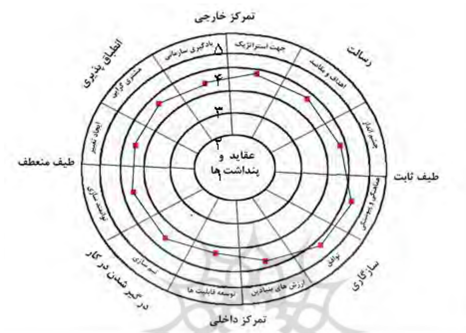
شکل ۳. شمای کلی فرهنگ سازمانی در اداره کل ورزش و جوانان استان آذربایجان غربی

نگاهی به این نمودار نشان می‌دهد که اداره کل ورزش و جوانان استان آذربایجان غربی به لحاظ فرهنگ سازمانی، در ابعاد سازگاری و مأموریت وضعیت قابل قبولی دارد و در ابعاد انطباق پذیری و به خصوص درگیر شدن در کار نیازمند توجه و برنامه ریزی در جهت بهبود است. نمودار ۳ فرهنگ سازمانی منطبق با دیاگرام مدل دنیسون هم چنین نشان می‌دهد که فرهنگ سازمانی در اداره کل مورد بررسی از جهت تمرکز داخلی و خارجی تقریباً وضعیت مشابهی دارد و از حیث میزان انعطاف پذیری، بیشتر ثابت و غیر منعطف است.