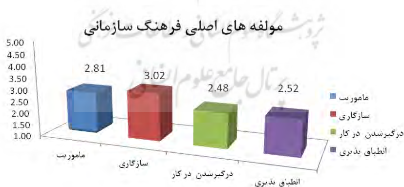
شکل ۱. مولفه های اصلی فرهنگ سازمانی

الف- امتیازات مربوط به مولفه های اصلی فرهنگ سازمانی