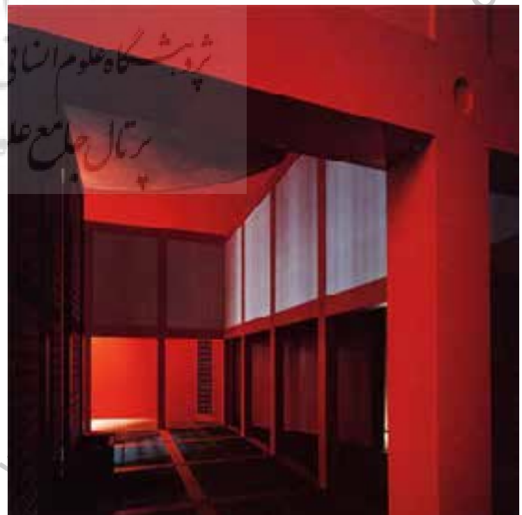
تصویر شماره ۶: تادائو آندو، معبد آب، زیر معبد، (سایت معمار پروژه)