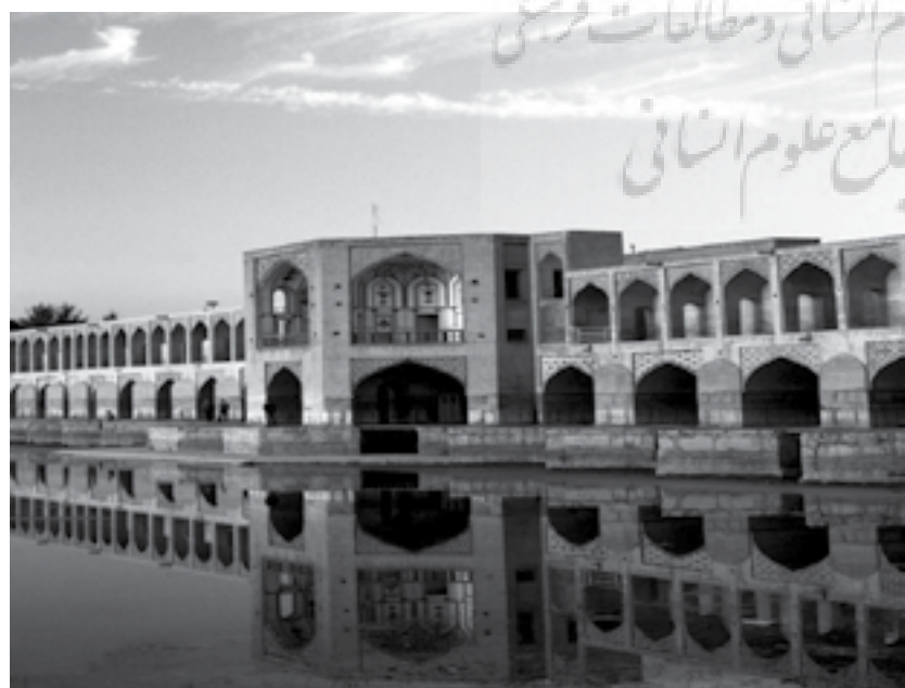
تصویر شماره ۳: پل خواجه و ترکیب بندی قرینه آن با آب

«ریتم و حرکت دو عنصر لاینفک می باشند. حرکت زمانی ایجاد می شود که عنصر یا پدیده ای تکراری و ریتمیک وجود داشته باشد. از ابتدا که انسان به ضربان قلب و صدای تنفس خود گوش کرد و با ریتم آن آشنا شد، آن را با صداهایی انطباق داد و صداهای ریتمیک به وجود آورد و آن را موسیقی نام گذاشت. ریتم در شعر به صورت رباعی، دوبیتی، غزل، قصیده از قوانین ریتمیک برخوردار است. ریتم برای ۳ قوه قابل ادراک است: برای گوش (شنوایی) به صورت نیرویی مخفی و درونی، برای چشم (بینایی) به صورت ظاهری و برای قوه عضلانی.» (حلیمی، ۱۳۹۱: ۱۲۱۴ الی ۲۲۲)