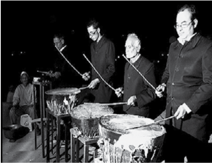
تصویر شماره ۱: مراسم طبل زنی همراه با اذان در بشرویه، (سایت گلشن طبس)

موسیقی مصر باستان است، از سرچشمه موسیقی اقوام آریایی کهن سیراب می شود و به موسیقی یونانی، که فیثاغورث از آن سخن می گفت، بی شباهت نیست. اما در دوره اسلامی، موسیقی طریق دیگری در پیش گرفت و مسیری را دنبال دارد که بیش از پیش صبغه نظارگی ۱۳۲ داشت. اسلام با منع و تحریم وجه اجتماعی موسیقی، موسیقی کلاسیک ایرانی را به مسیری باطنی هدایت کرد و آن را به هنری نظارگر بدل ساخت. حالات معنوی که موسیقی سنتی ایرانی برمی انگیزد، با «احوال» عرفا و از این طریق با روح قرآن پیوند دارد.» (نصر، ۱۳۸۹: ۸۹)