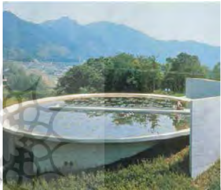
تصویر شماره ۵: تادائو آندو، معبد آب، نمای بیرونی، (سایت معمار پروژه)