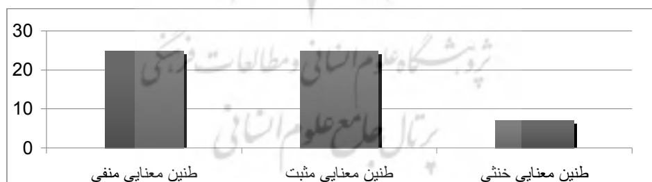
نمودار ۳: طنین معنایی عبارت «سبب...شدن»

از میان ۵۷ جمله موجود که عبارت فعلی «سبب...شدن» را در بر گرفته‌اند، در ۲۵ جمله این عبارت با کلمات مثبت و در ۲۵ جمله دیگر با کلمات منفی هم‌نشینی دارند و در ۷ جمله می‌توان معنی خشی را برداشت کرد. در مقایسه با مترادف‌های این عبارت فعلی، یعنی «موجب...شدن» و «باعث...شدن»، هم‌نشینی این عبارت با کلماتی که بار معنایی مثبت دارند، بیشتر است. تنها ۲۰ جمله از ۵۷ جمله در جدول بالا به عنوان نمونه آمده است. به نمودار شماره ۳ برای دریافت طنین معنایی این عبارت فعلی توجه نمایید.