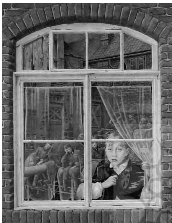
واقع‌گرایی در تصویرگری کتاب‌های کودکان، اینو چنتی

در واقع‌گرایی کودکانه که شکل ساده شده و کودکانه واقع‌گرایی (رئالیسم) است، بسیاری از جزئیات تصویری حذف می‌شود و عناصر تصویری در اندازه و علاقه‌های کودکانه دنبال می‌گردد. ویژگی خلاصگی (استیلیزه کردن) تصویر، سبب می‌شود که تصویرگر به فراخور درک و علاقه‌مندی‌های کودکان در گروه‌های سنی مختلف، از طرح جزئیات صرف نظر کند. رنگ‌آمیزی در این‌گونه تصویرها، با توجهی کم‌تر به ارزش‌های رنگی (تالیته) و کاربرد سایه - روشن همراه است. به کارگیری رنگ‌های تخت