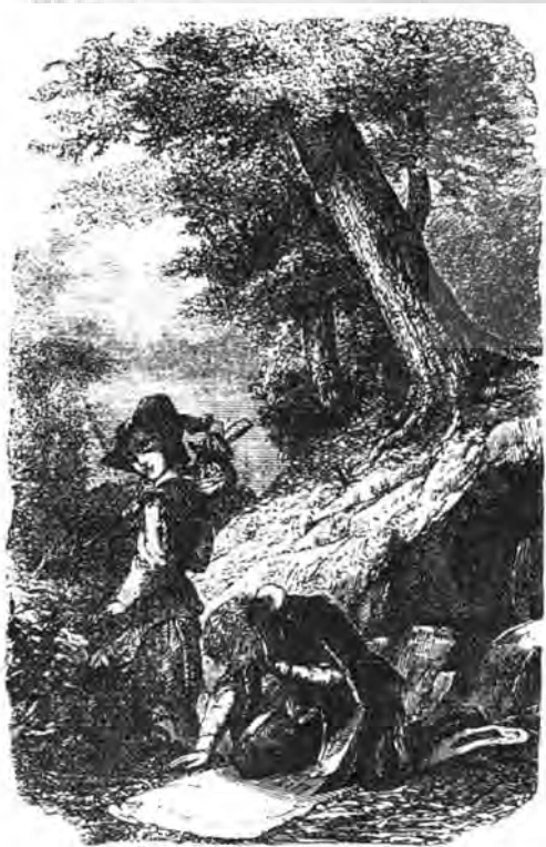
واقع‌نمایی در تصویرگری کتاب «حکایت زویل بلاس» تصویرگر: ابراهیم عکاس‌باشی، سال ۱۲۸۱ ش. چاپ سنگی

«هنر بازنما که گاه واقع‌گرا نامیده می‌شود، موضوع‌ها را به همان گونه که در زندگی روزانه هستند، تصویر می‌کند. هنرمندان واقع‌گرا نیازی نمی‌بینند که تصویرهای خود را درست مانند عکس بازآفرینی کنند. آن‌ها ترکیب‌بندی‌هایی می‌آفرینند که طرح‌های انسانی، اجسام یا پدیده‌های طبیعی را به گونه‌ای واقعی نشان دهند. شمار فراوانی از نقاشی‌ها و مجسمه‌های بسیار مشهور، مانند "مونالیزا"ی داوینچی و "متفکر" آگوست رودن ، در سبک واقع‌گرا هستند.» ۱۷ در هنر واقع‌نما، خیال‌پردازی و آشنا ساختن کودک با ساختار قهرمانان قصه، فضای زندگی آن‌ها و روند رویدادهای قصه اهمیت می‌یابد و آشنایی کودک با شرایط تاریخی، جغرافیایی، فرهنگی و اجتماعی عناصر تصویرگری داستان با بهره‌جویی از ویژگی‌هایی بومی و منطقه‌ای رویداد داستان صورت می‌گیرد. تصویرگر در شخصیت‌پردازی، پوشش و شکل ظاهری قهرمان‌ها به خوبی می‌تواند از ویژگی واقع‌گرایی در تصویر سود جوید و همپای روایت داستان، آن‌ها را به کودک باز نمایاند. این ویژگی در متن‌هایی با درون‌مایه‌های علمی و اطلاعاتی، جدی‌تر و دقیق‌تر است و خیال‌گرایی تصویر، کم‌تر. در حالی که در تصویرهای انتزاعی، شکل ظاهری، فضای زندگی، پوشش و تعلق فرهنگی قهرمانان قصه اهمیت چندانی ندارد و عنصر