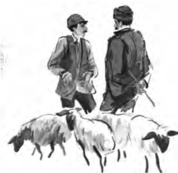
واقع‌گرایی در تصویرگری کتاب «علی و برفی»، پرویز حیدرزاده