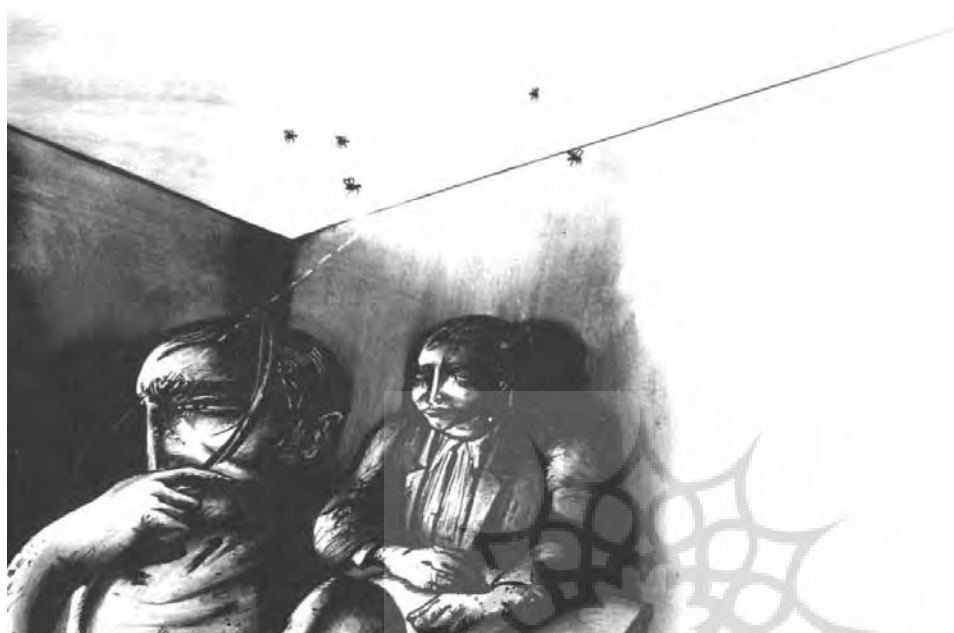
ویژگی‌های اکسپرسیونیسم در تصویرگری کتاب «دشنه»، پژمان رحیمی‌زاده

اکسپرسیونیسم در آثار وحید نصیریان ، در کتاب‌های روزی که آسمان شکست، کوراوغلو و ترس و لرز، با بهره‌گیری از آب‌مرکب و زمینه‌های سیاه فراهم شده و به ویژگی‌های هنر نقاشی نزدیک است. چهره‌ها در این کتاب که مناسب نوجوانان و بزرگسالان است، سرشار از ترس و دلهره‌ای است که در فضای داستان چندان وجود ندارد. تصویرهای این کتاب، زمینه مناسبی برای آشنایی نوجوانان با هنر بزرگسالان است. نگار فرجیانی ، در کتاب کلاته نان، افسانه جابری ، در کتاب اولدوز و کلاغها، محمد فاسونکی ، در کتاب عزاداران بی‌بیل و محمدعلی بنی‌اسدی ، در کتاب‌های سرخ و آبی و باغبان، ژنرال و گل‌سرخ نیز تصویرهایی اکسپرسیونیستی پدید آورده‌اند که پیوند میان علاقه‌مندی‌های نوجوانان و دنیای بزرگسالان به شمار می‌آید. محمد مهدی طباطبایی ، در تصویرگری کتاب یک راه دور و دراز و علی‌رضا گلدوزیان ، در کتاب‌های این همانی و قند و نمک، سبک اکسپرسیونیسم را به شیوه‌ای مناسب درک و علاقه‌مندی‌های کودکان به کار برده‌اند. تصویرهای حیوانی کتاب این هماهنگی، هر کدام بیانگر یکی از شخصیت‌های انسانی متن است که به دلیل درون‌مایه انتقادآمیز متن، هم‌چون آثار فرانسیسکو گویا، نقاش طنزپرداز اسپانیایی، به شکل حیوان درآمده‌اند.