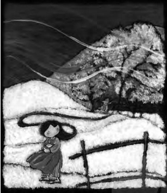
ویژگی‌های امپرسیونیسم در تصویرگری کتاب «همه‌ناز و چهار برادران»، لیسا جمیله برجسته

لرزانی به وجود می‌آورند. در تصاویر امپرسیونیستی کتاب‌های کودکان، بیننده به سرعت متوجه گونه جدیدی از هنر می‌شود که خالی از تشریفات است و در آن نقش‌هایی با خطوط تفکیک یافته و جدا، جدا تصویر می‌شود. به نظر نمی‌رسد که در این سبک، به خود اشیا توجهی شود، بلکه تصویرگر آن‌ها را همان‌طور می‌کشد که حس‌شان می‌کند. ۳۶