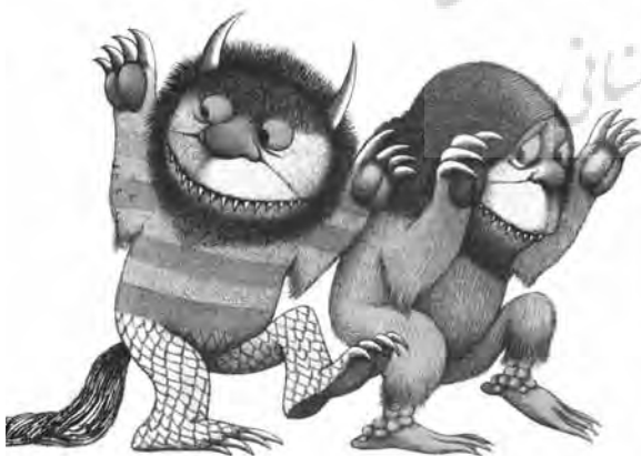
ویژگی‌های اکسپرسیونیسم در تصویرگری کتاب «آن‌جا که وحشی‌ها هستند»، موریس سنداک