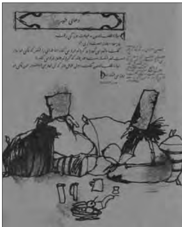
۱۱- صفحه آرای در کتاب «حکایت‌نامه»

صفحه آرا: کوروش پارساژاده، تصویرگر: بهرام خائف