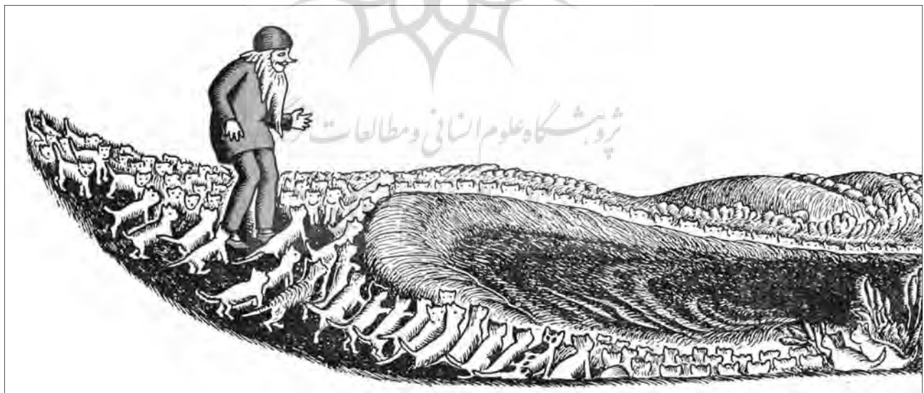
۹ - ریتم (ضرباهنگ) در کتاب «میلیون‌ها گربه»، ونداگ

تکرار متوازن لکه‌های رنگ و فرم‌های پی‌درپی در یک تصویر، نشانگر ضرباهنگ موجود در تصویر است. وجود رنگ‌های حنایی در آثار گوناگون امیر شعبانی‌پور، نشانگر ضرباهنگ پنهان در آثار مختلف اوست. تکرار لکه‌های رنگی در کتاب‌های علی کوچولو و دوستانش و لی‌لی‌لی حوضک، اثر مرتضی زاهدی و کتاب هدیه حیوانات، اثر سیروس آقاخانی، نشانگر ریتم و نواخت موسیقایی رنگ‌ها در تصویر است. حرکت دسته‌جمعی گربه‌ها در تصویرهای کتاب میلیون‌ها گربه، اثر ونداگ، مسیرهای گوناگونی آفریده که با نواختی حساب شده و موزون همراه است. این ویژگی در تصویرهای تکرار شده کتاب در جست‌وجوی قطعه گم شده، اثر شل سیلوراستاین نیز درخششی درخور دارد.