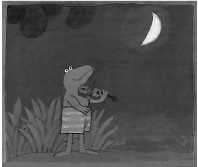
۱- ترکیب‌بندی ساده در آثار ماکس ولتوس