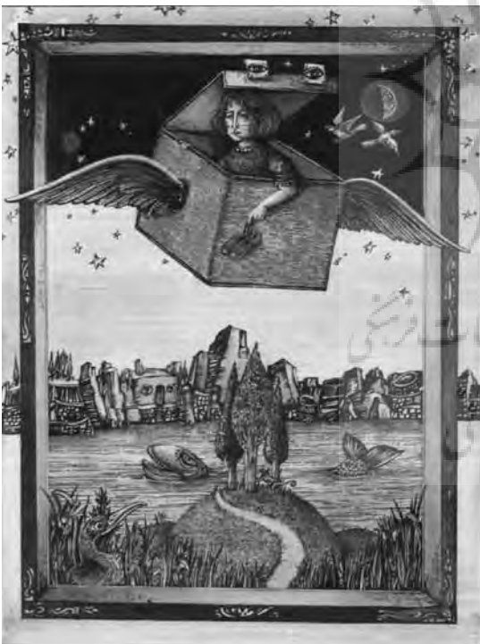
۳- ترکیب‌بندی در آثار سوررئالیستی، در کتاب «خاطره رویای کودکی»، تصویرگر: پژمان رحیمی زاده

ایجاد شگفتی، همان عنصر غافل‌گیرکننده‌ای است که از هم‌کناری و ترکیب‌بندی عجیب و غریب عناصر ترکیبی، به ویژه در هنر سوررئالیسم پدید می‌آید. پدیده ترکیب‌بندی در تصویرهای شگرف و غیر معمول سالوادور دالی ، عنصر مسلطی است که بار اصلی رؤیای‌آفرینی و شگفتی‌سازی تصویرهای او را فراهم می‌آورد. این ویژگی در آثار تصویرگران مدرن، جلوه‌های تازه‌ای می‌یابد؛ جلوه‌هایی که با کنایه و آشنایی‌زدایی در تصویر همراه است. بهره‌وری از توانایی‌های رایانه‌ای