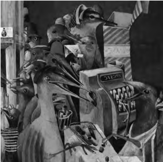
۲- ترکیب‌بندی پیچیده و دشوار در آثار دوشان کالای

در هنر تصویرگری که پیوند میان روایت داستانی در ادبیات و زیبایی‌شناسی دیداری در هنر نقاشی است، تصویرگر به فراخور سبک و تکنیک‌های به کار گرفته شده، عناصر مرسوم را مورد توجه قرار می‌دهد. از سوی دیگر، عناصری نیز به تصویرگری افزوده شده که به دلیل تأکید بر داستان موجود در متن یا هدف بیانی (ایلوستراسیون) در کتاب‌های تصویری، علمی، داستانی، اطلاعاتی و غیر آن و نیز نقش حضور متن در کنار تصویر، مورد توجه قرار می‌گیرد. از جمله چنین متن و تصویر (لی‌اوت) و سفیدخوانی، عناصری هستند که به دلیل حضور متن در کتاب، شکل می‌گیرند و در هنر نقاشی جایی برای آن‌ها وجود ندارد. پدیده ترکیب‌بندی در تصویرگری، ضمن رعایت زیبایی‌شناسی دیداری، بر پایه سیر روایت داستانی و تأکید بر عناصر محتوایی متن صورت می‌گیرد.