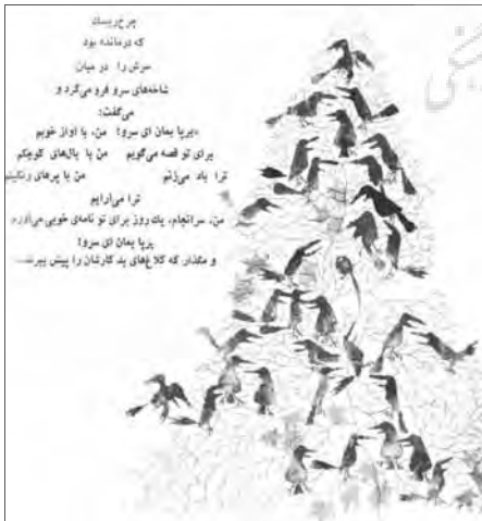
۱۲- چینش متن به صورت درخت سرو در کتاب «کلاغ‌ها، نورالدین زرین کلک»

صفحه آرا: کوروش پارساژاده، تصویرگر: بهرام خائف