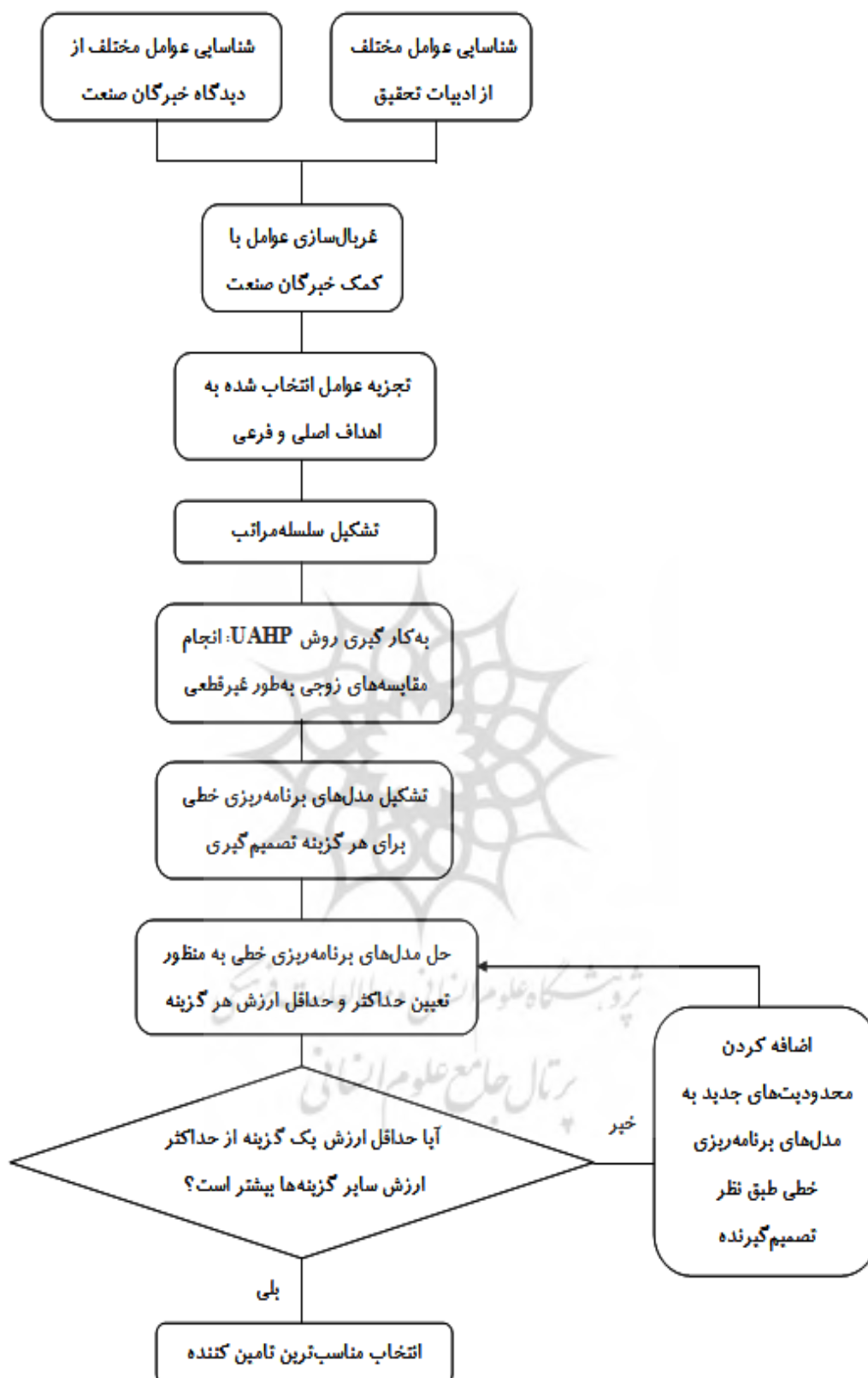
شکل ۱: خلاصه‌ای از مراحل انجام تحقیق