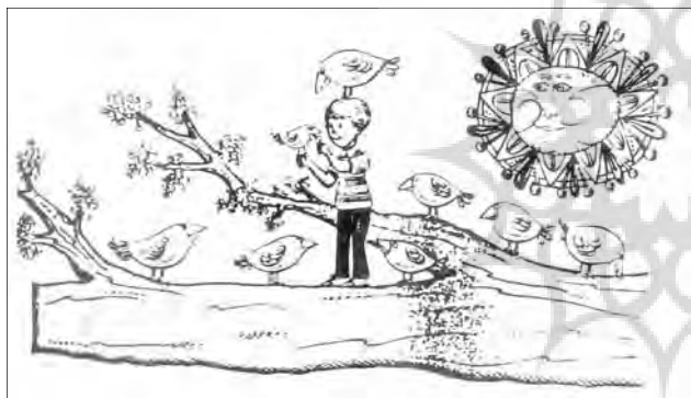
سبک منسجم و علاقه به فرم، از ویژگی‌های اولف لوف گرن است. تصویر فوق، مربوط به کتاب «درخت شگفت انگیز»، چاپ ۱۹۶۹ است.

مشخصه بسیاری از کتاب‌های جدید، موفقیت متن و تصویر، هر دو با هم است. مشخصه دیگر این که همدلی با زندگی عاطفی کودک، مرتبته استثنایی یافت و