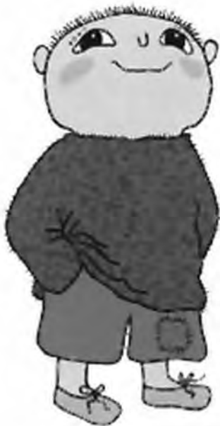
کتاب «آلفونس آبری» (الفی اتکینز)، اثر گونیلبری استروم، از معدود کتاب‌های سوئدی است که به زبان عربی ترجمه شده است.

این فانتزی مدرن که نوعی سفر رویایی سنتی است، دنیای وحش جنگل را نشان می‌دهد. او بر نیروی تخیل و فراتر از آن، در اختیار گذاشتن آن برای بهره‌گیری مستقل کودک تأکید دارد و بر این اساس، کتاب مصور «سفر شبانه» را در سال ۱۹۹۰ پدید آورد که از کتاب‌های دیگر متمایز است. او با کتاب «ابتدا تاریک بود»، چاپ ۱۹۹۲ و کتاب «مینا و کوگ» ۴۷ که داستان احساسات عمیق بین دو خرس است که با هم