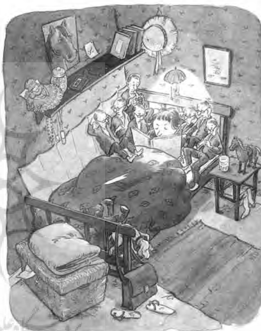
تصویری از کتاب طنزآمیز «السه - ماریا و هفت پدر کوچولوی او» که بیانگر رابطه بین پدر و دختر است.

تصویرگران مانند نویسندگان، وظیفه خطیری دارند. اینگر ۲۲ (م ۱۹۳۰) و لسه سندبرگ ۲۳ (م ۱۹۲۴) - معلم و سازنده تصاویر متحرک - این وظیفه را با هم به عهده گرفتند و در ۱۹۵۳ با هم، اولین اثر خود را به نام «ادریک گوسفند، مدال می‌گیرد»، منتشر کردند. آن‌ها در واقع احیا کننده کتاب‌های مصور بودند، هم از نظر موضوع و هم از نظر بیان هنری. تصاویر سندبرگ، به علت سبک ساده وی،