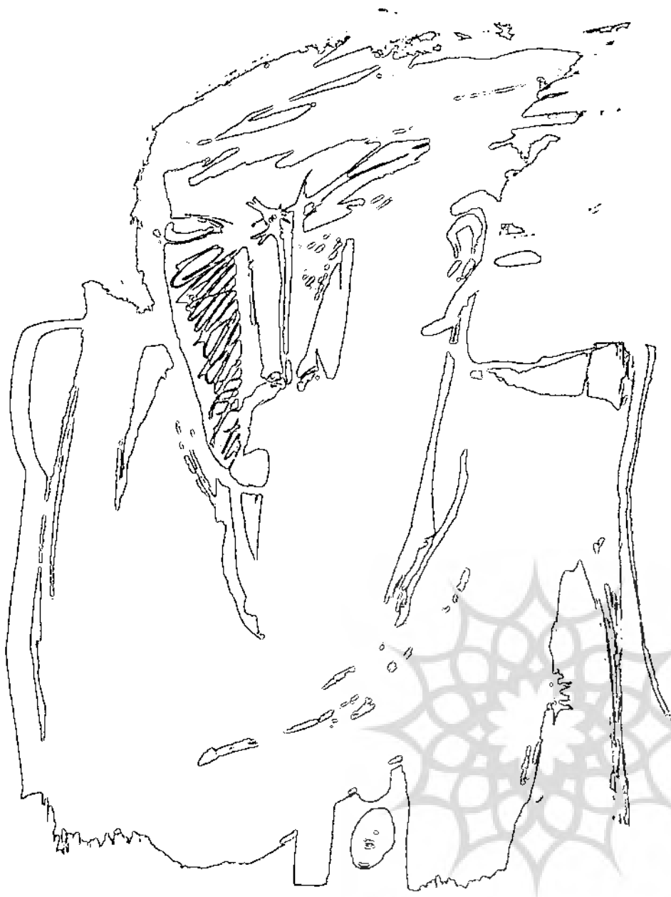
(Bos Tarnai, ۱۹۸۹, S. ۱)

نمونه مورد بررسی از ادبیات برگزیده کودک و نوجوان آلمان و اتریش، با استفاده از روش تحلیل محتوا بررسی شد. در پژوهش‌های کاربردی، روش تحلیل محتوا، روشی پذیرفته شده است که برای ارزشیابی کمی و کیفی داده‌های زبانی [شینداری و گفتاری]، از طریق طبقه‌بندی و رده‌بندی به کار می‌رود. «روش تحلیل محتوا بر پایه این اصل شکل گرفته که هرگونه کنش فرهنگی، به معنای عام، به صورت متن قابل ثبت است. به گفته دیگر، تحلیل محتوای متون، با واقعیت اجتماعی مرتبط بوده، نتایج به دست آمده، به آن واقعیت‌ها بستگی دارد.»