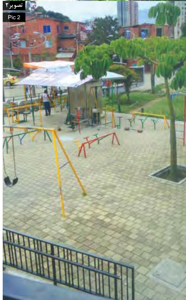
تصویر ۲ Pic 2

بی‌تردید، این مداخلات کیفیت زندگی بسیاری از ساکنین محله کامونا ۱۳ را بهبود بخشیده است. انتقادهای گوناگون مطرح شده در مصاحبه‌هایی که با متخصصان و کارمندان PUI انجام شد، معضلات توسعه شهری را روشن می‌کند. عدم وجود همکاری‌های بین نهادی و نبود ثبات طراحی شمایی، به عنوان نقطه ضعفی برای یکپارچگی و پایداری زیست‌محیطی پروژه مطرح بوده و همچنین عدم پاسخگویی به جنبه‌های هویتی و فرهنگی شهر در آن مشهود است. این حقیقت که PUI ها شدیداً وابسته به نظام سیاسی شهر هستند، منجر به کاهش کیفیت مشارکت‌های شهروندی و عدم تمایل مدیران برای گسترش ابزارهای ارزیابی کیفی زیست‌محیطی، اقتصادی و توسعه پایدار اجتماعی شده است. به نظر می‌رسد تمرکز بر مداخلات فضایی و ایجاد جذابیت‌های توریستی منجر به رویکرد ناتمام به یکپارچگی پروژه و توجه ناکافی به تنوع فرهنگی