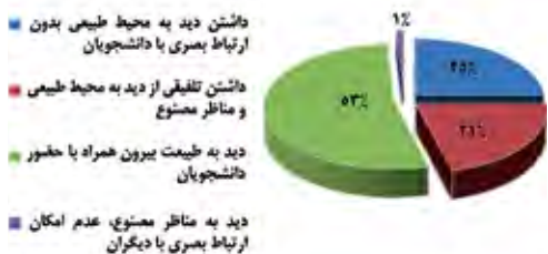
Diagram 1. Environmental needs priority evaluation in studio.

از آنجا که منظر مناسب در تأمین امنیت روانی نقش مهمی دارد (smith, 2009)، لذا فراهم‌کننده بخش مهمی از نیازهای دانشجویان است.