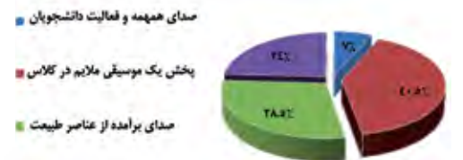
Diagram 3. Assessment of studio walls quality.

نتایج نشان می‌دهد با آنکه طبیعت یکی از عوامل مهم انتخابی دانشجویان است ولی درصد کمی از آنها حضور در طبیعت بدون هیچ‌گونه حصار و قیدی را برای فعالیت آموزشی خود مناسب دانسته و اکثریت ترجیح داده‌اند روند آموزشی در یک فضای تعریف‌شده با دید مطلوب به طبیعت صورت پذیرد.