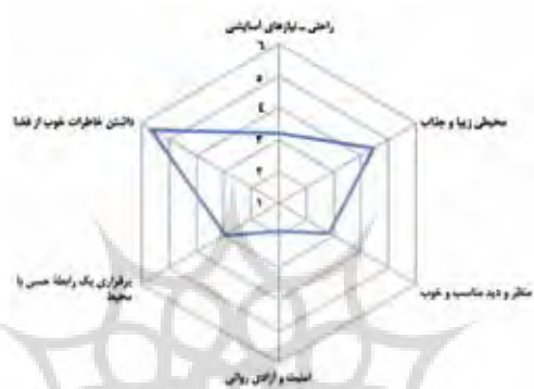
Diagram 5. evaluation of student's viewpoint in relation with desired sound in studio.

نمودار ۵. نمودار سنجش دیدگاه دانشجویان در ارتباط با طنین صدای مطلوب در آتلیه.