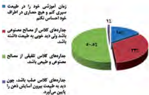
Diagram 2. View quality assessment to outside nature.

توانایی تمرکز مستقیم افراد را دارد. این نظریه به خصوص در مکان‌های آموزشی مورد بررسی قرار گرفته و روی فرایندهای شناختی متمرکز است.