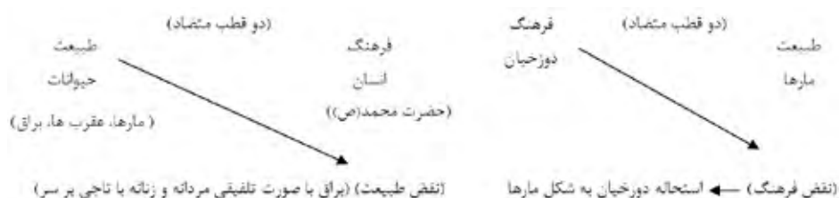
تصویر ۷. دو قطب متضاد.

ضمنی، راست به زندگی اشاره می‌کند که از نشانه‌های بیانگر این موضوع در نظام‌های شماره (۱) وجود پیامبر(ص) به همراه جبرائیل و ردای سبز رنگ ایشان و همچنین رنگ‌های آبی و سرزنده موجود در بال فرشته جبرائیل است. و در نظام تصویری شماره (۲) دانته و ویرژیل که با لباس مرسوم آن زمان به همراه شاخه‌هایی از زیتون بر سر نشان داده شده‌اند. قطب چپ از نظر معنای ضمنی به مرگ اشاره دارد، که از نشانه‌های دال بر این موضوع در هر دو نظام تصویری وجود مأموران عذاب همراه با ابزار شکنجه در دست و دوزخیان مورد شکنجه است همچنین از دیگر معناهای ضمنی بین دو قطب راست و چپ می‌توان به بیرون و درون نیز اشاره کرد. که در اینجا منظور از بیرون یعنی به دور از عذاب و قهر الهی