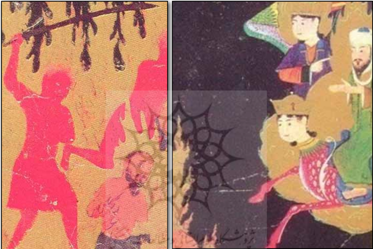
تصویر ۳. جزئی از نظام تصویری شماره ۱. Fig. 3. A part of the figurative system number 1.

همان‌طور که در نظام تصویری شماره (۱) دیده می‌شود، کادر به دو قسمت مجزا تقسیم می‌شود که تقریباً در ترکیب‌بندی تصاویر دوزخی نسخه معراج‌نامه شاهرخی و همچنین اغلب نقاشی‌های