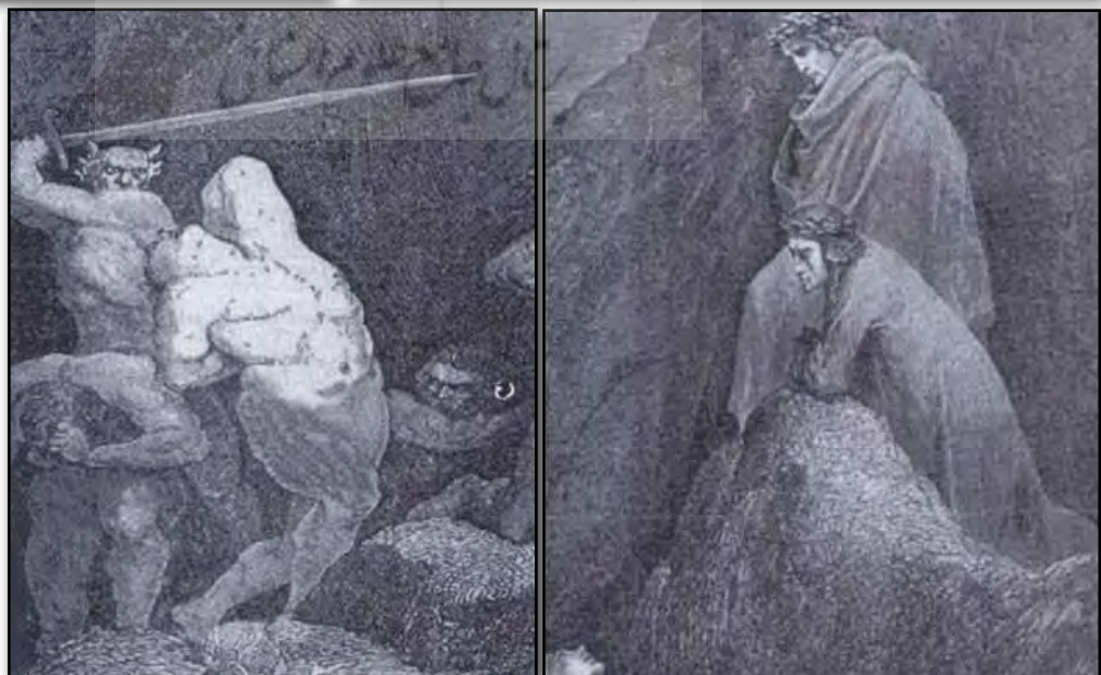
تصویر ۴. جزئی از نظام تصویری شماره ۲. Fig. 4 A part of the figurative system number 2.