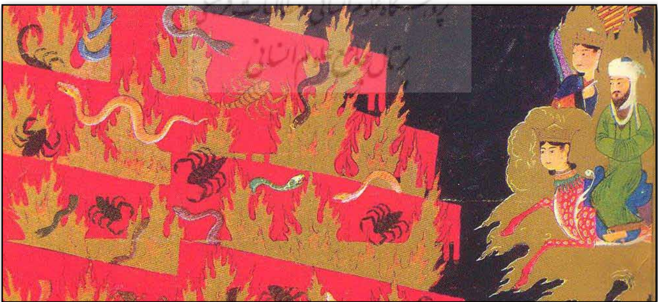
تصویر ۵. نظام تصویری شماره ۳. شکنجه متکبران توسط خزندگان.

از آنجا که از ویژگی‌های اساسی داستان معراج پیامبر(ص) حرکت از پایین به بالاست، می‌توان مهم‌ترین نشانه دال بر این موضوع را قرار گرفتن کنشگران اصلی (پیامبر(ص) با جبرئیل و براق) متمایل به سمت بالای کادر دانست که حرکتی از راست به سمت چپ را القاء می‌کند. می‌توان این گونه استنباط کرد که علاوه بر دلایل نقلی و رمزی شاید گفته پرداز نظام تصویری در بیان تصویری و کیفیات تجسمی، علاوه بر نوع نگرش، تخیلات و اعتقادات (با توجه به محتوا) به بینامتن‌های دیگری غیر از روایت‌های مذکور در متن نوشتاری این نسخه توجه کرده است (روایت‌هایی همچون روایت انس بن مالک و امام بغوی که در این نسخه خطی آورده شده است). همانند قرار دادن عناصر مثبت در سمت راست تصویر که اشاره به آیات قرآن سوره الحاقه (آیات ۲۲-۱۹ و ۲۶) و انشقاق (آیات ۷ تا ۹) دارد و از نظر معنای ضمنی اشاره به یمین می‌کند. یمین به معنای راست است و اصحاب یمین همان جمعیت سعادت‌مندی هستند که نامه اعمالشان به علامت پیروزی در آزمون‌های الهی به دست راستشان داده می‌شود و در مقابل قرار دادن عناصر منفی و دوزخیان در سمت چپ که اشاره به آیات (۲۴ تا ۲۷ سوره الحاقه) و که از نظر معنایی اشاره به اصحاب شمال دارد. "اما کسی که نامه اعمالش را به دست چپش بدهند می‌گوید: ای کاش هرگز نامه اعمالم را به من نمی‌دادند..." (مکارم شیرازی، ۱۳۸۹: ۱۲۹). "و این رمزی است برای آنکه گناهکار، ستمگر و اهل دوزخند و تعبیری برای بیان نهایت خوبی یا بدی حال کسی است." (تفسیر نمونه، ج ۲۳: ۲۳۵). همانند این ترکیب بندی در نظام تصویری شماره (۲) قرار گرفتن دانته و ویرژیل در سمت بالا و راست کادر تصویر است که حرکت از راست به چپ را نیز در مورد این کنشگران القاء می‌کند. با این تفاوت که حرکت