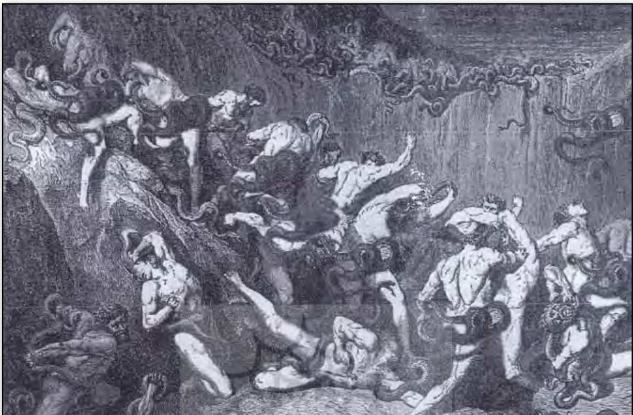
تصویر ۶. نظام تصویری شماره ۴. شکنجه دزدان و سارقان توسط خزندگان. سرود ۲۴ از بخش دوزخ کتاب کمدی الهی دانته. Fig. 6. Figurative system number 4. The Fraudulent ones and Schismatics tortured. Devine Comedy The Inferno: Canto 24.

و درون یعنی چشیدن عذاب الهی به دلیل انجام اعمال زشت و نکوهیده. از دیگر نشانه‌های بیانگر بیرون در هر دو نظام تصویری وجود آرامش در حالات کنشگران نسبت به حالت‌های پریپیچ و تاب موجود در حرکات دوزخیان است به ویژه در نظام تصویری شماره (۲) که بیانگر شدت درد و رنجی است که این دوزخیان متحمل می‌شوند و پایانی برای آن وجود ندارد و همچنین استفاده از رنگ قرمز در چهره‌ها که از لحاظ بصری، دمای سوزان جهنم، اندوه گناهکاران و وجود آتش سوزان شکنجه شده را منتقل می‌کند. البته از دیگر قطب‌های این دو نظام تصویری کنشگران اصلی در بالای کادر اشاره کرد در هر دو نظام تصویری کنشگران اصلی در بالای کادر تصویری نشان داده شده‌اند که می‌تواند به معنای ضمنی آسمانی و