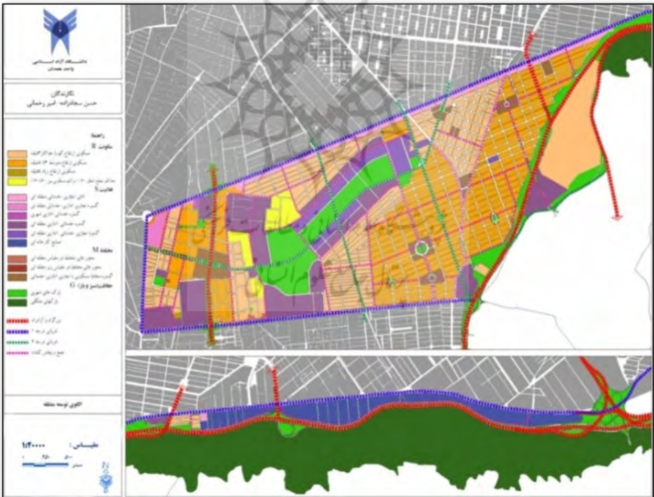
تصویر ۳. الگوی توسعه پیشنهادی منطقه ۱۳ شهر تهران.