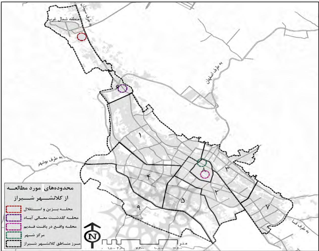
تصویر ۱. موقعیت محله‌های مورد مطالعه در کلان‌شهر شیراز.