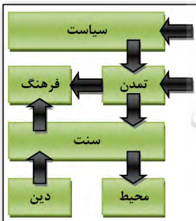
تصویر ۷. فرآیند تحول هویت در شهرهای نفتی

لذا می‌توان تحول هویت و ایجاد هویت شرکتی را چنین تشریح کرد: به دلیل ضعف دولت مرکزی، شرکت نفت توانست پس از تعامل با خوانین و شیوخ، خود را به عنوان رهبر و برنامه‌ریز (سیاست) در منطقه مطرح کند. با ورود فناوری و خدمات نوین زندگی (تمدن) به منطقه، بخش عمده‌ای از جامعه روستایی و عشایری آن به خدمت شرکت نفت درآمدند که آشنایی اولیه ایشان و سپس استفاده از خدمات رفاهی و مسکونی انگلیسی‌ها، به تغییر رفتارها و شکل زندگی گذشته (سنت) و پس از آن تحول ارتباطات اجتماعی، ارتباط با طبیعت، اولویت طبقه شغلی بر قومیت و گذشته تاریخی (محیط) منجر شد. همچنین توسعه فرهنگی، اجتماعی و ورزشی باعث ایجاد طبقات فرهنگی و روشنفکر در جامعه جدید شد و توانست هویتی مستقل ایجاد کند که فرهنگ آن از یک سو با تمدن نوین در تماس بود و از گذشته خود، دین و برخی آداب و رسوم را حفظ کرده بود.