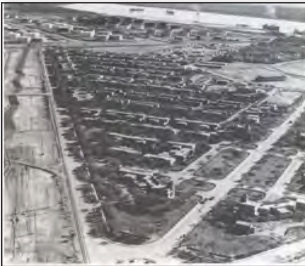
تصویر ۵. محله بواره آبادان، طراحی در سال ۱۹۳۴ مأخذ: Crinson, 2003. Fig.5. Bawarda Town in Abadan, Source: Crinson, 2003.