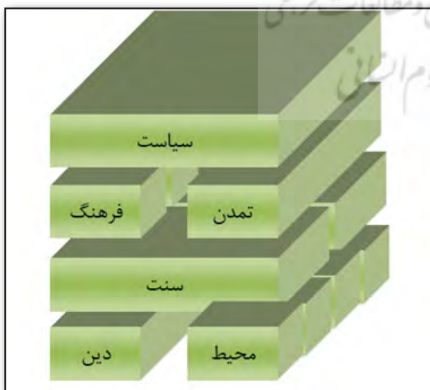
تصویر ۳. الگوی توسعه یافته هویت مأخذ: نگارندگان

به عنوان مثال این الگو می‌تواند گویای کل کشور باشد که تحت یک حاکمیت سیاسی واحد با محیط‌های انسانی، طبیعی و سنت‌های متفاوت گرد هم جمع شده‌اند. درحالی که آنچه تا کنون از هویت ارایه شده است نمودی از هویت ملی و سیاسی واحد، بدون تفاوت‌های فرهنگی، قومی و منطقه‌ای بوده که برخی نارضایتی‌ها و نافرمانی‌های قومی در بسیاری مناطق وجود دارد.