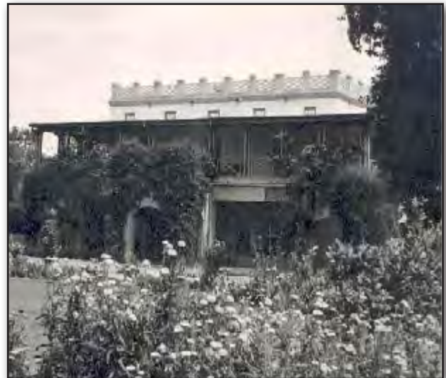
تصویر ۴. یکی از اولین بنگله‌های آبادان (شماره ۳). Fig.4. One of the First Bungalows in Abadan (No.3).