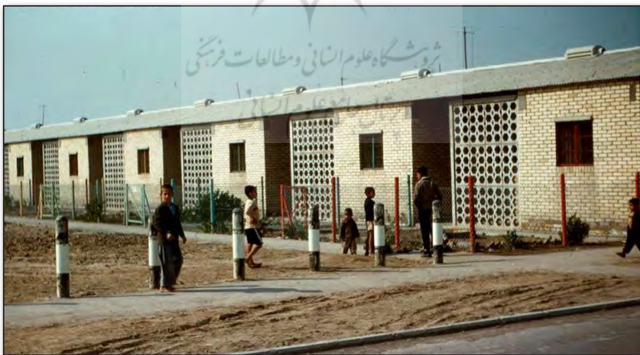
تصویر ۶: محله‌های کارگری پس از ملی شدن نفت، سال ۱۳۳۷

ب) تمدن : تمدن مهم‌ترین عامل تحول هویت در خوزستان بود. چرا که زمان اکتشاف نفت (سال ۱۹۰۸ م) مقارن با سال‌های ۱۸۷۰ تا ۱۹۱۴ میلادی از بسیاری جهات دوره تعیین‌کننده‌ای در جهان معاصر غرب بوده و بسیاری از اختراعات و تحولات در این زمان اتفاق افتاده است. ۸ همچنین در سال‌های بعد، آخرین دستاوردهای نظری رایج در غرب در حوزه شهرسازی مانند نظریه باغ‌شهرها و نیز خدماتی چون راه‌های آسفalte، خودرو، تأسیسات برقی و مکانیکی، آب لوله‌کشی بهداشتی و ... به شهرهای نفتی وارد شد. این اختلافات شدید تمدنی باعث شد که تمدن مترقی غرب به راحتی و بدون هیچ مقاومتی در این مناطق پذیرفته و برخوردار از آنها به آرزو و عامل فخر بسیاری از مردم تبدیل شود. در مقابل شهرهایی همچون شوشتر و دزفول که از سابقه تمدن