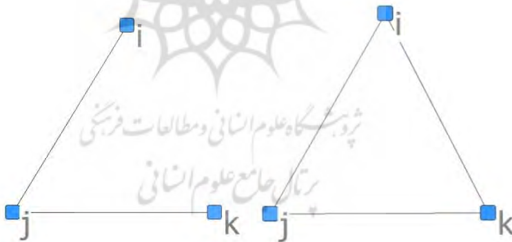
شکل ۱. گراف انتقال پذیر و غیرانتقال پذیر

تراپایی ۱ : یک گراف سه گانه شامل سه بازیگر شامل i ، j و k انتقال پذیر است. اگر i \leftarrow j و j \leftarrow k آنگاه i \leftarrow k ؛ انتقال پذیری یک سنجه برای تعداد سه گانه‌های کامل در سازمان است (Wassermann and Faust 1994). گراف سمت چپ در شکل ۱، یک سه گانه تراپا و گراف سمت راست غیرانتقال پذیر است؛ تراپایی تعداد سه گانه‌های تراپا در شبکه را اندازه می‌گیرد و میزان تعادل و ثبات در جریان ارتباطات را نشان می‌دهد (Merrill et al. 2007). این سنجه نشان‌دهنده همکاری بین عوامل برای به اشتراک گذاری اطلاعات است. شبیه‌سازی‌های سازمانی نشان می‌دهد که شکل‌گیری سه گانه‌ها به ثبات سازمانی کمک می‌کند و باعث همجوشی اطلاعات، وفاق کاری و افزایش عملکرد خواهد شد. البته در طول زمان، با ثبات پیدا کردن ساختار سازمان تعداد بیشتری سه گانه به وجود می‌آید، گرچه طول عمر آنها کاهش پیدا می‌کند (Carley and Hill 2001).