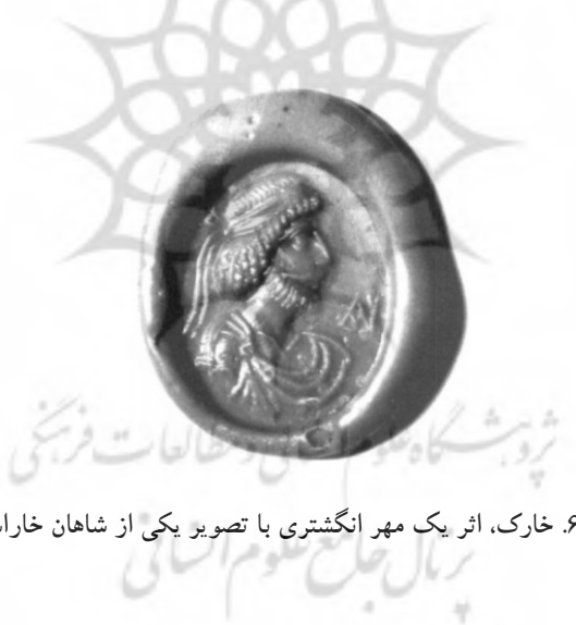
تصویر ۶. خارک، اثر یک مهر انگشتی با تصویر یکی از شاهان خراسن. ۲