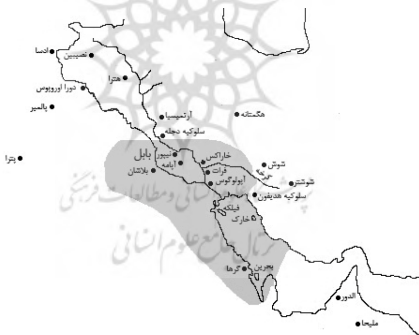
نقشه ۲. قلمرو پادشاهی خاراسن در اوج گسترش (نگارندگان).