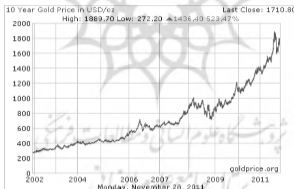
نگاره (۱): قیمت جهانی طلا از سال ۲۰۰۰ تا ۲۰۱۱

سال‌های ۲۰۰۷ تا ۲۰۰۸؛ در طی سال ۲۰۰۷ قیمت طلا روند معمولی را با افزایش و کاهش قیمت نفت و دلار سپری می‌کرد تا این که در نوامبر ۲۰۰۷ طلا ماکسیمم قیمت یعنی ۸۴۵ دلار را طی ۲۸ سال خود تجربه نمود. این افزایش به دلیل شروع بحران مالی ۲۰۰۷، سقوط شاخص بازار سهام در اروپا و آسیا، کاهش نرخ بهره بانکی در آمریکا و تشدید رکود اقتصادی آمریکا بوده است. در سال ۲۰۰۸ قیمت طلا به رکورد ۱۰۰۰ دلاری خود رسید. در این سال قیمت طلا با بروز بحران مسکن در آمریکا، افزایش قابل توجه نرخ تورم، کاهش نرخ بهره و شاخص‌های بورس که کاهش ارزش دلار را به همراه داشت و رشد بی‌سابقه قیمت نفت (به دلیل کاهش صادرات نفت به اروپا) سیر صعودی را طی کرد. افت شدید و کاهش قیمت طلا در چند ماه از سال ۲۰۰۸ ناشی از فروش ذخیره طلای بانک‌های مرکزی ۱۵ کشور اروپایی برای تأمین نقدینگی، پرداخت بدهی و بهبود بحران مالی می‌باشد.