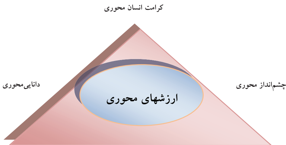
شکل ۲: الگوی ارزشهای محوری تعالی سازمانی بخش دولتی

الگوی نهایی تحقیق نتایج به دست آمده از بررسی ادبیات و انجام نظرخواهی