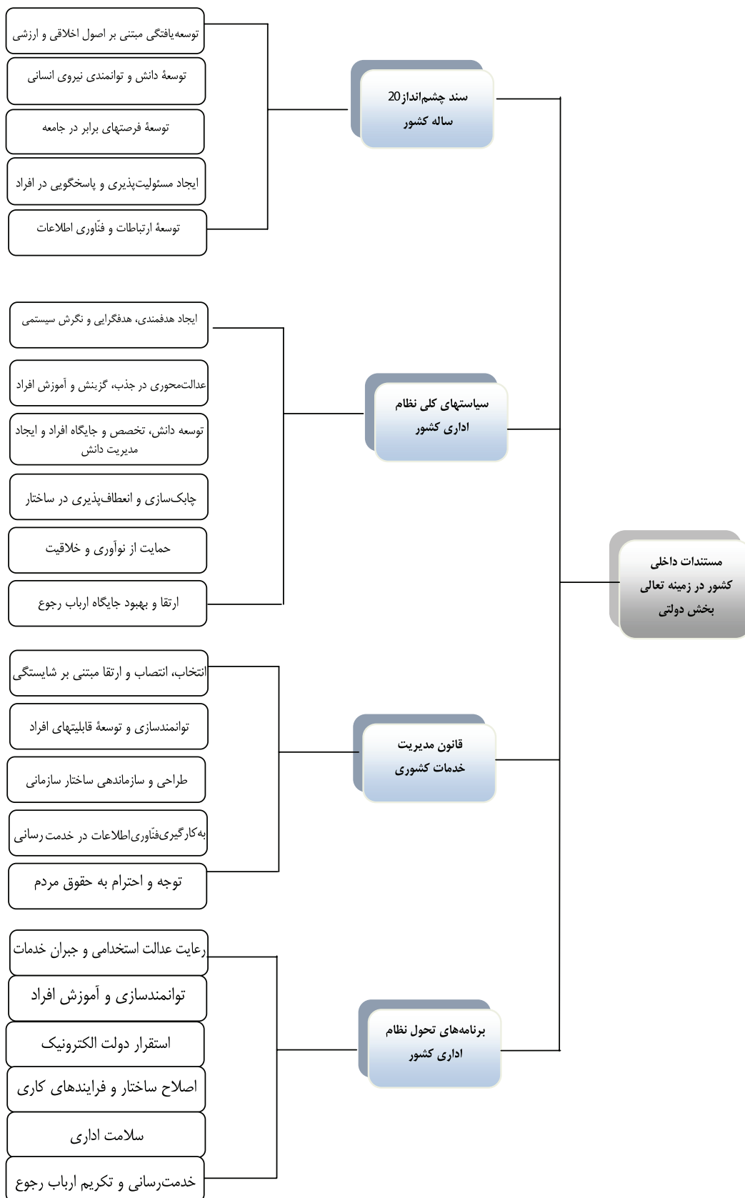
شکل ۱: تحلیل مستندات داخلی

کشور، برنامه‌های تحول نظام اداری کشور، قانون مدیریت خدمات کشوری و سند چشم‌انداز ۲۰ ساله