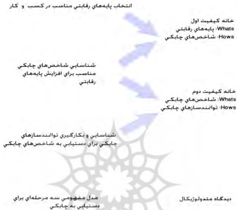
شکل ۱ رویکرد متدولوژیکال برای دستیابی به چابکی [۷]

همان‌گونه که در شکل مشاهده می‌شود، رویکرد پیشنهادی نیاز به ساختن دو HOQ دارد که ساختار ویژه آن در شکل ۲ به نمایش درآمده است: