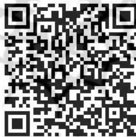
شکل ۱ بارکد دوبعدی پرسشنامه تحقیق

عاملی ۱۱ و نرم افزار "اس پی اس اس" ۱۲ استفاده به عمل آمده است. [۱۱] جامعه آماری این تحقیق در مرحله اول خبرگان و متخصصان حوزه مدیریت و فن آوری اطلاعات می‌باشند. در مرحله دوم، جامعه مجازی ایران، به‌عنوان جامعه آماری انتخاب گردید. برای به دست آوردن تخمین واریانس جامعه و حجم نمونه، ابتدا تعداد ۳۰ پرسشنامه به صورت پیش‌آزمون در بین نمونه آماری توزیع شد، و حجم نمونه ۳۱۲ به دست آمد. با این وجود مرحله جمع‌آوری پرسشنامه تا ۳۵۰ نمونه قابل قبول ادامه پیدا کرد. این تحقیق جهت جمع‌آوری داده‌ها از پرسشنامه آنلاین بهره‌جسته است، بدین منظور لینک پرسشنامه به همراه نامه همکاری در تحقیق برای کاربران اینترنت به صورت تصادفی ارسال شد. همچنین جهت سهولت در پاسخگویی توسط کاربران بارکد دوبعدی QR-Code ۱۳ طراحی شد و در محیط وب قرار گرفت. بدینوسیله کاربران می‌توانستند با گوشی تلفن همراه و اسکن بارکد دوبعدی (شکل ۱) نسبت به پاسخگویی به سوالات تحقیق اقدام کنند.