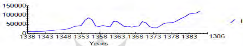
نمودار ۴: تغییرات هزینه‌های سرمایه‌گذاری بخش خصوصی

خصوصی به قیمت ثابت تا سال ۱۳۵۵ سعودی بوده است، سپس در اثر ناآرامی‌های داخلی روند نزولی به خود گرفته است. در طول سال‌های ۱۳۶۱-۱۳۵۶ به دلیل وقوع انقلاب اسلامی، تحریم اقتصادی و جنگ تحمیلی روند نزولی ادامه یافته است. در طول جنگ تحمیلی روند ثابتی را برای خود حفظ نموده و پس از پایان جنگ در سال ۱۳۷۰-۱۳۶۷ دوباره روند صعودی یافته و پس از آن در فاصله ۱۳۷۴-۱۳۷۰ مقارن با شروع دوران سازندگی در برنامه اول توسعه مجدداً تنزل کرده و بعد از سال ۱۳۷۴ دوباره روند صعودی به خود گرفته است.