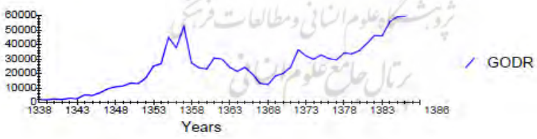
نمودار ۳: تغییرات هزینه‌های سرمایه‌گذاری بخش دولت

تغییرات هزینه‌های جاری واقعی دولت (پایه ۱۳۷۶) در نمودار ۳ نشان داده شده است. با بررسی اجمالی می‌توان گفت که هزینه‌های عمرانی واقعی دولت در سال ۱۳۵۵ به اوج خود رسیده و پس از آن، در دوره ۱۳۶۰-۱۳۵۶ از روندی نزولی داشته است. اگرچه در فاصله زمانی ۱۳۶۲-۱۳۶۰ به دلیل افزایش درآمدهای نفتی دوباره صعود نمود؛ اما تا سال ۱۳۶۸ به روند نزولی خود ادامه داد. با شروع برنامه اول و دوم توسعه، هزینه‌های عمرانی دولت افزایش یافت و این افزایش خود را با افت و خیزهای متمادی ادامه داد.