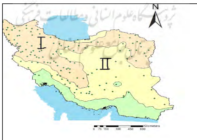
شکل ۲- پهنه بندی مناطق تولید کننده سیب آبی در کشور

در جدول ۱، شهرستانهای داخل منطقه یک گزارش شده است و در جدول ۲ نام شهرستانهای واقع در منطقه ۲ درج شده است. همانطور که در این جدول مشاهده می گردد منطقه یک شامل ۱۰۱ شهرستان از ۲۱ استان کشور می باشد. منطقه دو شامل ۴۳ شهرستان از ۱۲ استان کشور می باشد. ردیف های هر جدول همسایه های