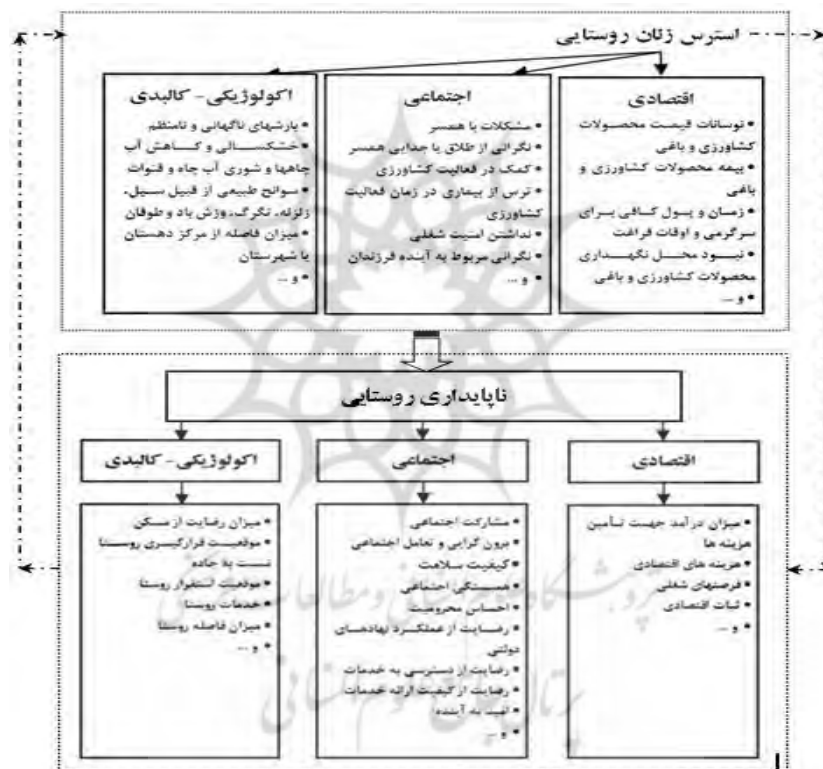
شکل ۲- مدل مفهومی تحقیق

به‌عنوان یک زیرمجموعه فعال، در مرز باریک بسیاری از علوم اجتماعی و پزشکی درحال فعالیت است. و سرانجام باید گفت موضوع سلامت زنان (برحان ۱ و همکاران، ۲۰۰۱) به صورت نیازی خارج از چارچوب بهداشت فرزند و مادر مورد توجه است. همان‌طور که مطالعات نشان می‌دهد، خدمات بهداشتی زنان تنها بر روی بهداشت تناسلی (مولد) آن‌ها متمرکز است و نیازهای بهداشتی وسیع‌تر زنان روستایی را فراهم نمی‌کند. شکل زیر مدل مفهومی تحقیق را نشان می‌دهد: