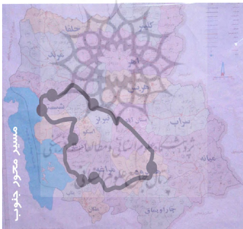
شکل (۲) قطب گردشگری مراغه

در طرح جامع گردشگری استان آذربایجان شرقی (۱۳۸۴) شهرستان مراغه به‌عنوان یک قطب گردشگری شامل ۳ محور و ۲۵ جاذبه مشخص شده است (شکل ۲) که از بین آنها ۹ جاذبه به مناطق روستایی بخش مرکزی شهرستان مراغه تعلق دارد و محور گردشگری سدلوویان، محور گردشگری گشایش و محور گردشگری جنوب سهند را در برمی‌گیرد (شکل ۳). توان‌های گردشگری این منطقه را جاذبه‌های طبیعی، جاذبه‌های مذهبی - تاریخی و فرهنگی تشکیل می‌دهند.