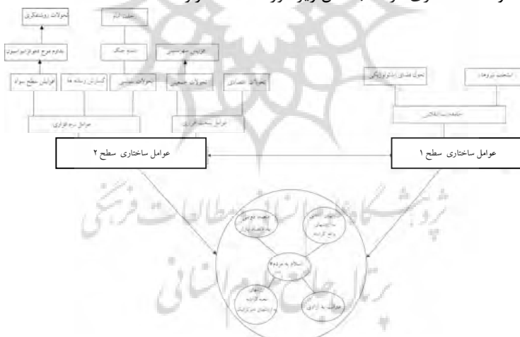
شکل ۲. مدل تبیینی تحول گفتمان مجمع روحانیون مبارز

در واقع حضور این راهبردها و راهکارها مبین تغییر پارادیمی در حوزه ارزشی جامعه است. به طوری که پیش از این محوریت برنامه‌های توسعه بر پایه عدالت بود اما با بروز و ظهور گرایش‌های اصلاح‌طلبی، آرمان‌های جامعه مدنی وارد برنامه‌های توسعه کشور شد بطوریکه در کنار جنبه‌های کمی توسعه اقتصادی سایر ابعاد توسعه که جنبه کیفی‌تری دارند از جمله توسعه اجتماعی و سیاسی مورد توجه قرار گرفت و آزادی در کنار عدالت قرار گرفت. همین امر زمینه را برای هرچه پخته‌تر شدن برنامه چهارم توسعه فراهم ساخت. به گونه‌ای که در تدوین این برنامه ابعاد مختلف توسعه لحاظ گردید. بر اساس آنچه در پیش آمد فرآیند تحول گفتمان مجمع روحانیون مبارز را می‌توان بر پایه دو سطح تحولات ساختاری در قالب مدل زیر مورد مطالعه قرار داد.