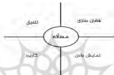
شکل ۱: چرخه چهار مرحله‌ای آموزشی (مریل ۲۰۰۲)

اصل تلفیق ۱ : وقتی یادگیرندگان دانش یا مهارت کسب شده جدید را در زندگی واقعی خود به کار ببرند، انگیزه آن‌ها بیش تر شده و موجب بهبود یادگیری می‌شود (مریل، ۲۰۰۹). در شکل ۱ چرخه چهار مرحله‌ای آموزش نشان داده شده است. همان‌طور که مشاهده می‌شود، مسئله یا تکلیف به‌عنوان محور آموزش قرار گرفته است و مراحل چهارگانه، یادگیرنده را برای حل مسئله یا تکلیف مورد نظر یاری می‌کند.