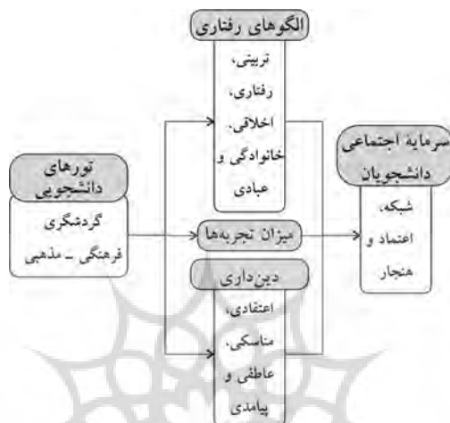
نمودار ۱. مدل مفهومی

راهکارهای ارائه شده است. در این خصوص ایجاد گروه‌های اجتماعی فعال در زمینه فرهنگی و مذهبی که افراد را در ارتباط شخصی و نزدیک با دیگران قرار می‌دهند، می‌تواند زمینه‌ساز تقویت پیوندهای اجتماعی، اعتماد و مشارکت‌های جمعی باشد که از کارکردهای اصلی سرمایه اجتماعی است. در ادامه با توجه به نظریه‌های مورد مطالعه، مدل مفهومی به شرح زیر ارائه شده است.