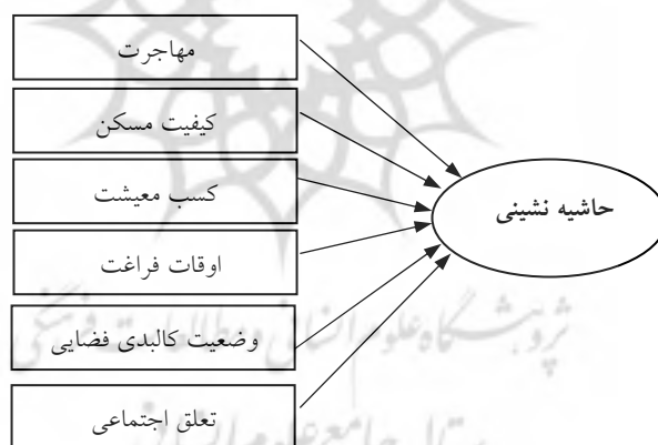
شکل ۱. مدل نظری تحقیق

حاشیه‌نشینی می‌شود. اما علت تامه حاشیه‌نشینی نیست (پارک، ۱۹۸۲: ۸۸۱). جامعه‌گرایان جدید نیز پدیده حاشیه‌نشینی را نتیجه نابرابری‌های اقتصادی- اجتماعی می‌دانند. اینان معتقدند که به دلیل بروز کمبودها و نارسایی تسهیلات زیربنایی، اجتماعی و کالبدی، محله‌های حاشیه‌نشین شکل می‌گیرند (حاج یوسفی، ۱۳۸۱: ۱۷). از نظر جامعه‌شناسان گروه‌ها و طبقاتی که مسلط بر منابع کمیاب اجتماعی شهری‌اند به موقعیت « زیست در متن» دست می‌یابند و در حیات جمعی نقش سوژگی ایفا می‌کنند. این خود مستلزم به حاشیه رانده شدگی طبقاتی است که در وضعیت « زیست در حاشیه» به سر می‌برند و در گستره فعالیت‌های شهری نقشی نیمه فعال یا غیرفعال دارند (ربانی و دیگران، ۱۳۸۳: ۸۳). مانوئل کاستلز حاشیه‌نشینی شهری را مولود نابرابری‌های اقتصادی- اجتماعی و شهرنشینی ناهمگون می‌داند (آقابخشی، ۱۳۸۲: ۱۸۹). در مجموع، در این تحقیق، با ترکیب نظریه‌های حاشیه‌نشینی و پیشینه تجربی تحقیق، حاشیه‌نشینی بر اساس شش متغیر مهاجرت، کیفیت مسکن، کسب معیشت، اوقات فراغت، وضعیت کالبدی فضایی و تعلق اجتماعی مورد بررسی قرار خواهد گرفت. این شش متغیر به صورت مدل تحلیلی در شکل شماره (۱) نشان داده شده‌اند.